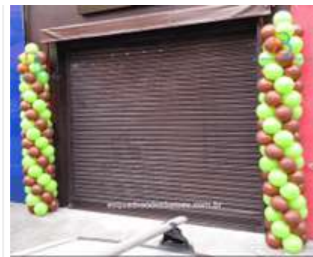
ou arco simples