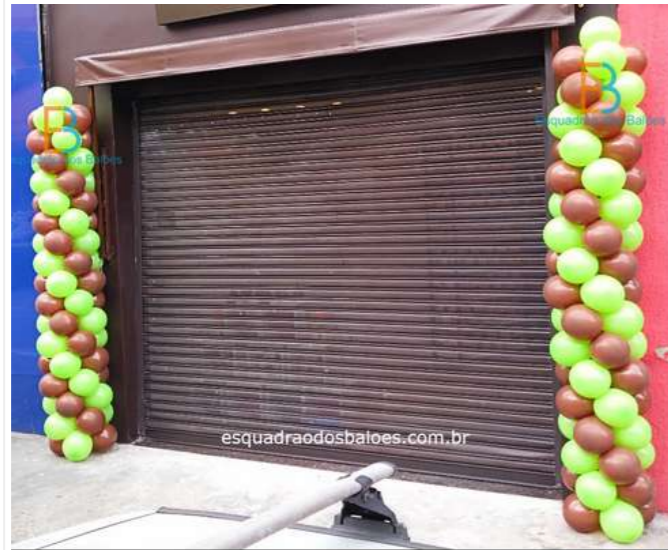
ou arco simples