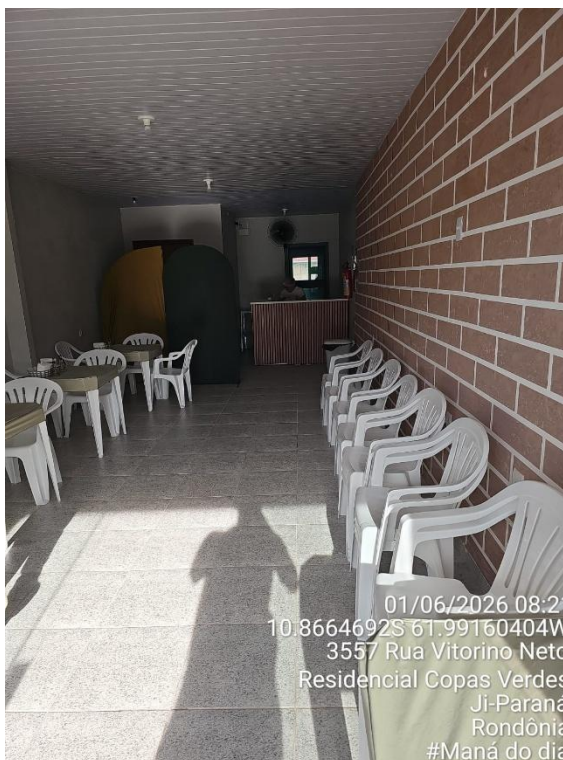
01/06/2026 08:21 10.8664692S 61.99160404W 3557 Rua Vitorino Neto Residencial Copas Verdes Ji-Paraná Rondônia #Maná do dia