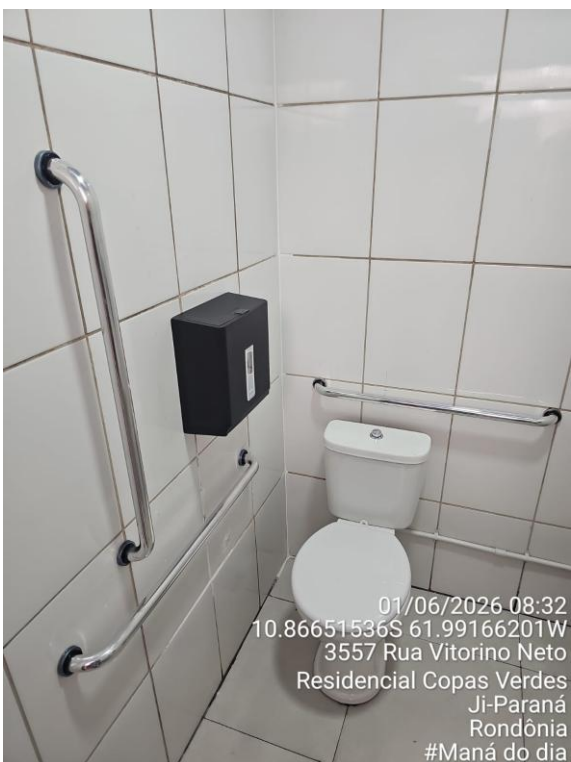
01/06/2026 08:32 10.86651536S 61.99166201W 3557 Rua Vitorino Neto Residencial Copas Verdes Ji-Paraná Rondônia #Maná do dia