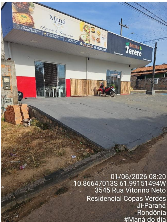
01/06/2026 08:20 10.86647013S 61.99151494W 3545 Rua Vitorino Neto Residencial Copas Verdes Ji-Paraná Rondônia #Maná do dia