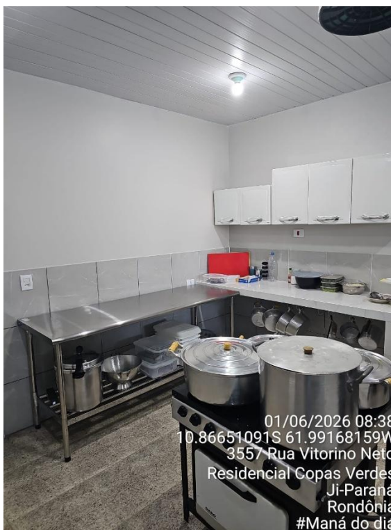
01/06/2026 08:38 10.86651091S 61.99168159W 3557 Rua Vitorino Neto Residencial Copas Verdes Ji-Paraná Rondônia #Maná do dia