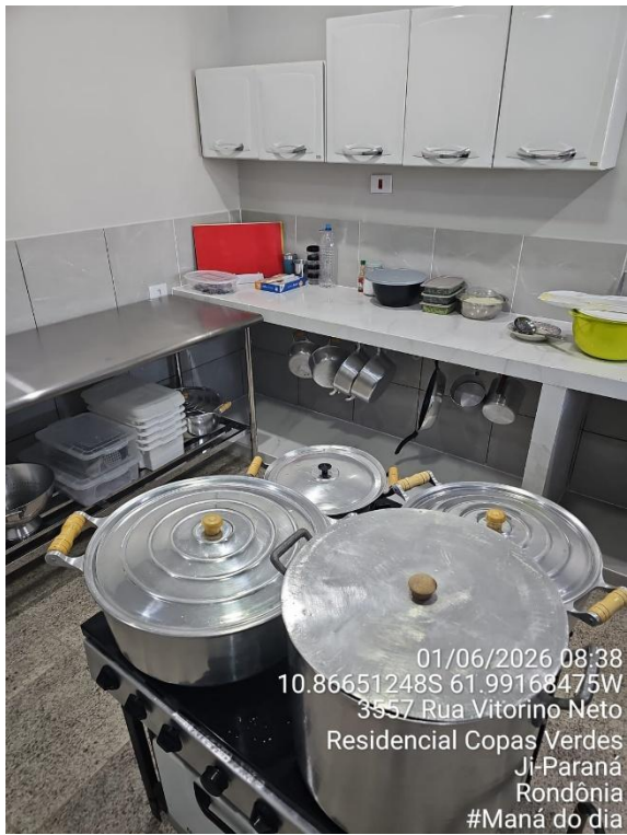
Imagens 06, 07 e 08 - Área de preparo, manipulação e armazenamento.