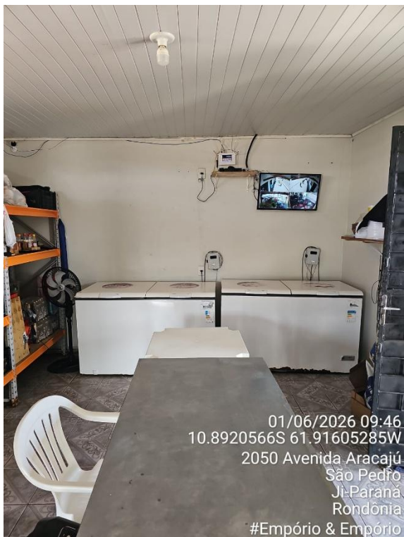
Imagens 12 e 13 - Área de preparo, manipulação e armazenamento.

01/06/2026 09:46 10.8920566S 61.91605285W 2050 Avenida Aracajú São Pedro Ji-Paraná Rondônia #Empório & Empório