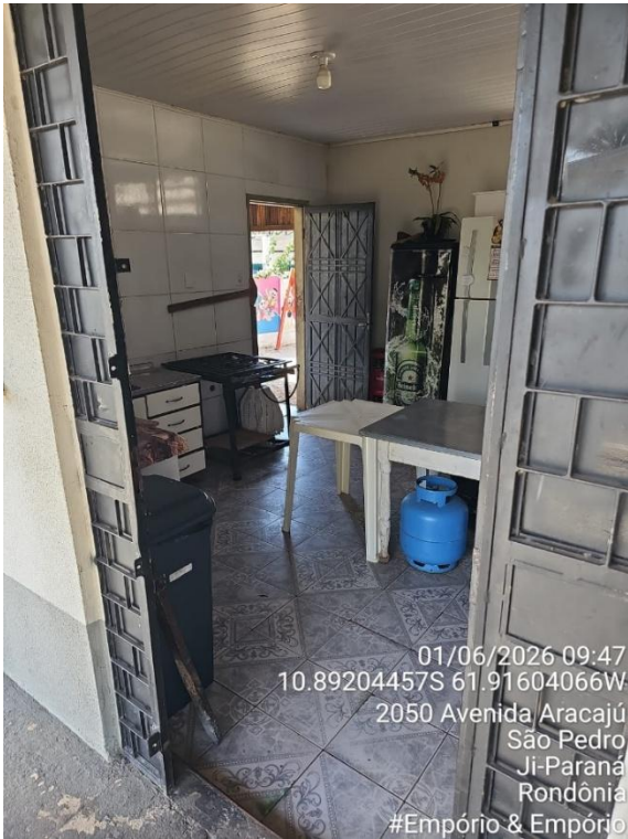
Imagem 23 - Área de preparo, manipulação e armazenamento.