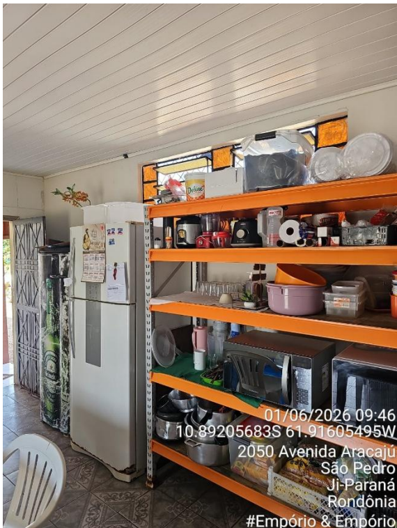
Imagens 25 e 26 - Área de preparo, manipulação e armazenamento.