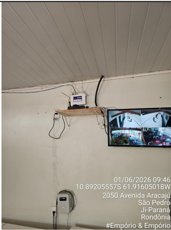
Imagens 14 e 15 - Área de preparo, manipulação e armazenamento.