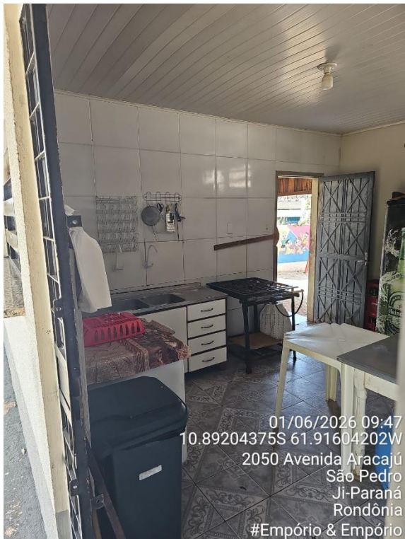
Imagens 08 e 09 - Área de preparo, manipulação e armazenamento.

01/06/2026 09:47 10.89204375S 61.91604202W 2050 Avenida Aracajú São Pedro Ji-Paraná Rondônia #Empório & Empório