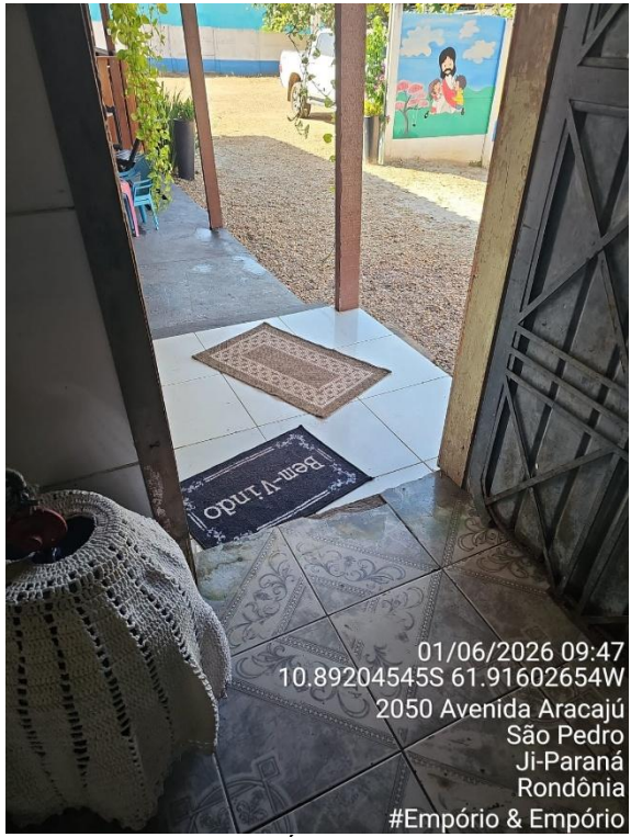
Imagens 19, 20, 21 e 22- Área de preparo, manipulação e armazenamento.