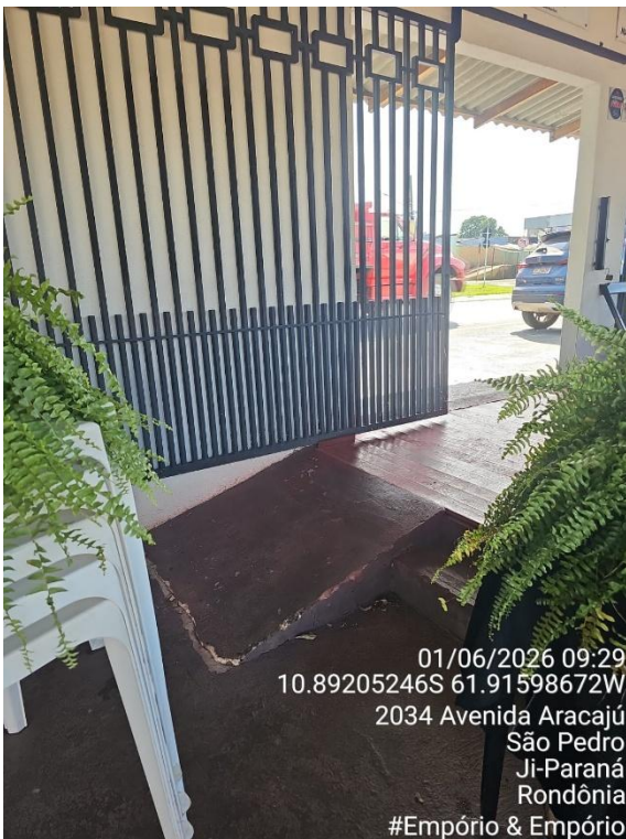
Imagem 05 e 06 - Área de preparo, manipulação e armazenamento.

Item 2.8 Rampas com inclinação igual ou menor que 8,33% imóveis novos e 12,5% para imóveis existentes. (item 6.6 – NBR 9050/20).