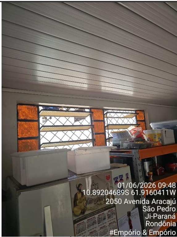
Imagens 10 e 11 - Área de preparo, manipulação e armazenamento.