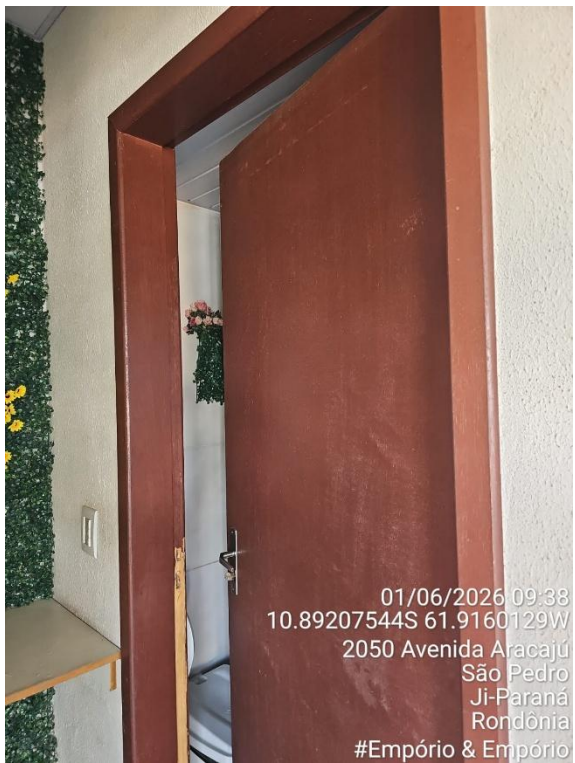
Imagem 07 - Área de preparo, manipulação e armazenamento.