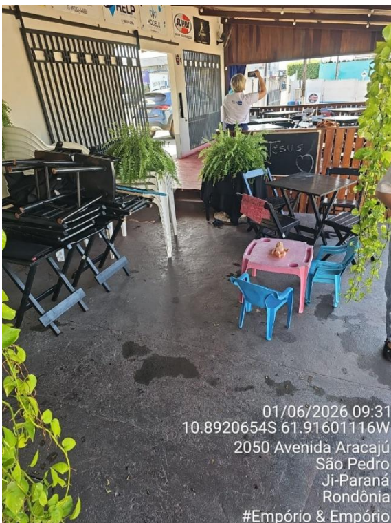
Imagem 24 - Área de preparo, manipulação e armazenamento.

Solução: Transferir os botijões ou cilindros de gás para áreas externas, protegidas de intempéries e bem ventiladas; Garantir que o local de armazenamento tenha ventilação permanente, com aberturas na parte inferior e superior.