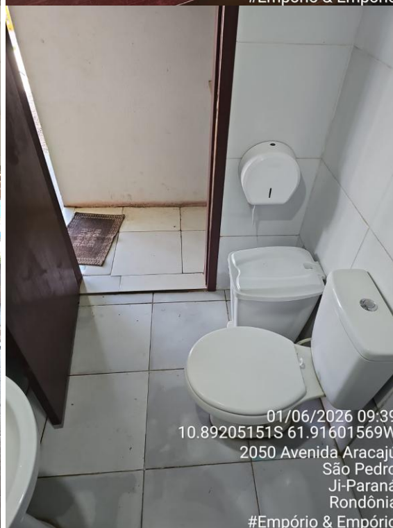
Imagens 01, 02, 03 e 04 - Fotos Gerais.