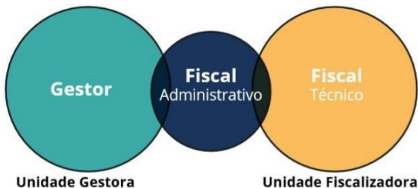
Figura 2 - Escopo de atuação do Gestor e do Fiscal no contrato