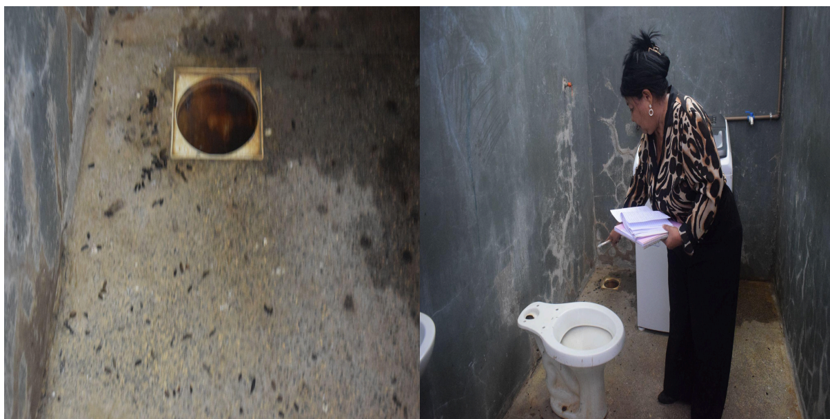
Figura 05 – Vestígios de fezes de roedores identificados nas dependências da lavanderia da unidade prisional, evidenciando possíveis falhas no controle de pragas e nas condições de higiene do ambiente, situação que pode representar risco à saúde das pessoas privadas de liberdade e dos servidores que utilizam o local.