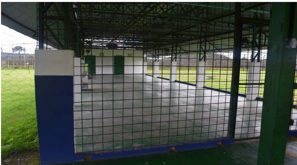
Figura 10 – Espaço destinado à realização de visitas sociais e familiares na unidade prisional, local onde os visitantes mantêm contato com seus familiares e cônjuges privados de liberdade. O ambiente é utilizado para a promoção e manutenção dos vínculos familiares e afetivos das pessoas custodiadas, constituindo importante instrumento para o processo de reintegração social.

Destaca-se como aspecto positivo a manutenção do salão de encontro familiar em condições adequadas de limpeza, organização e conservação, demonstrando preocupação da gestão da unidade com a garantia de ambiente apropriado para o exercício do direito à convivência familiar.