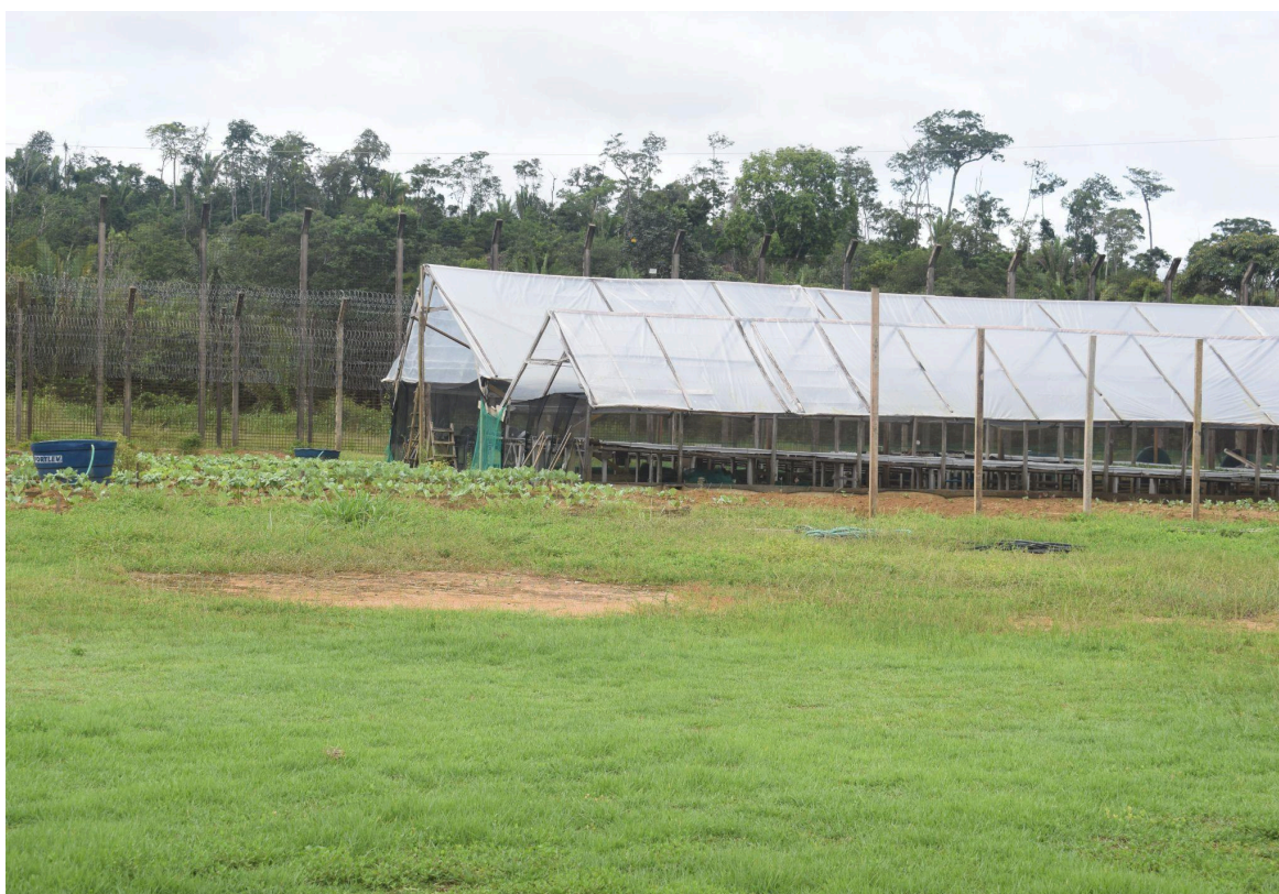
Figura 11 – Área destinada à horta existente na unidade prisional.

Não obstante os aspectos positivos identificados, verificou-se a necessidade de fortalecimento das medidas de segurança relacionadas à execução das atividades, especialmente quanto ao fornecimento regular de Equipamentos de Proteção Individual (EPIs) adequados às tarefas desempenhadas, de forma a reduzir riscos ocupacionais e assegurar a proteção da integridade física dos custodiados envolvidos no projeto.