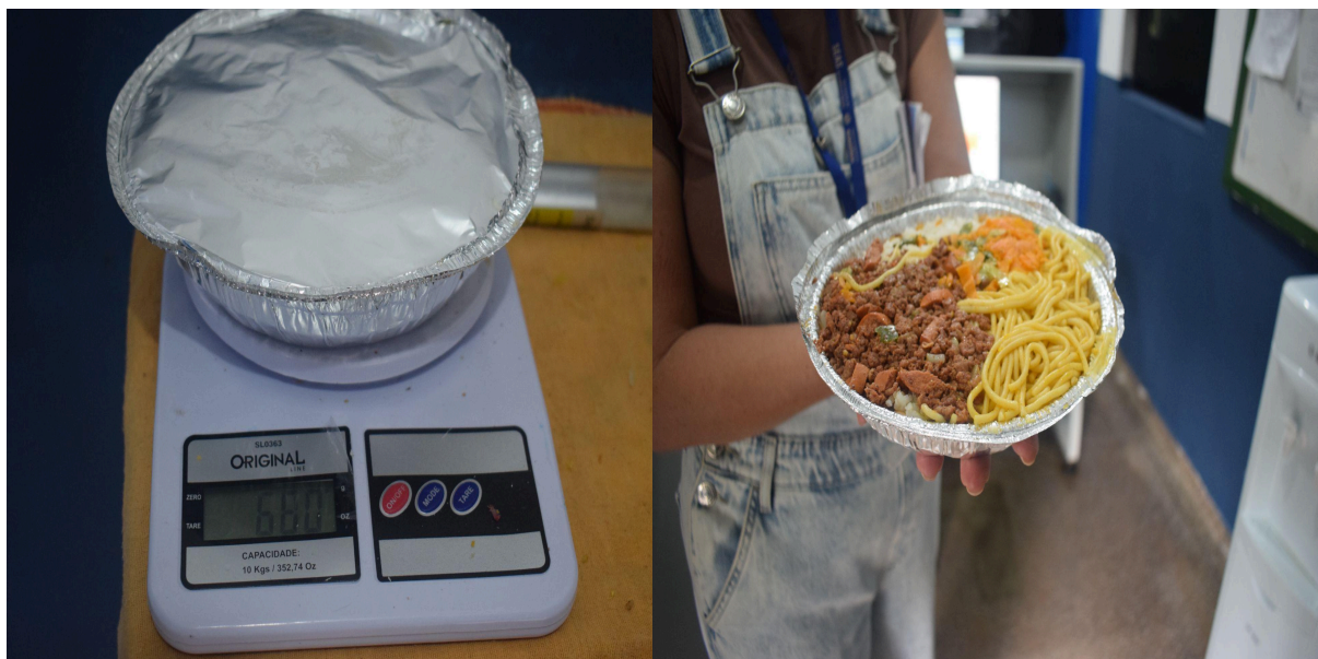
Figura 07 – Procedimento de pesagem das refeições fornecidas à população custodiada, realizado durante o recebimento dos alimentos na unidade prisional. A figura também apresenta registro da refeição que estava sendo ofertada aos internos na data da inspeção, permitindo a verificação das condições gerais e da composição do alimento disponibilizado.