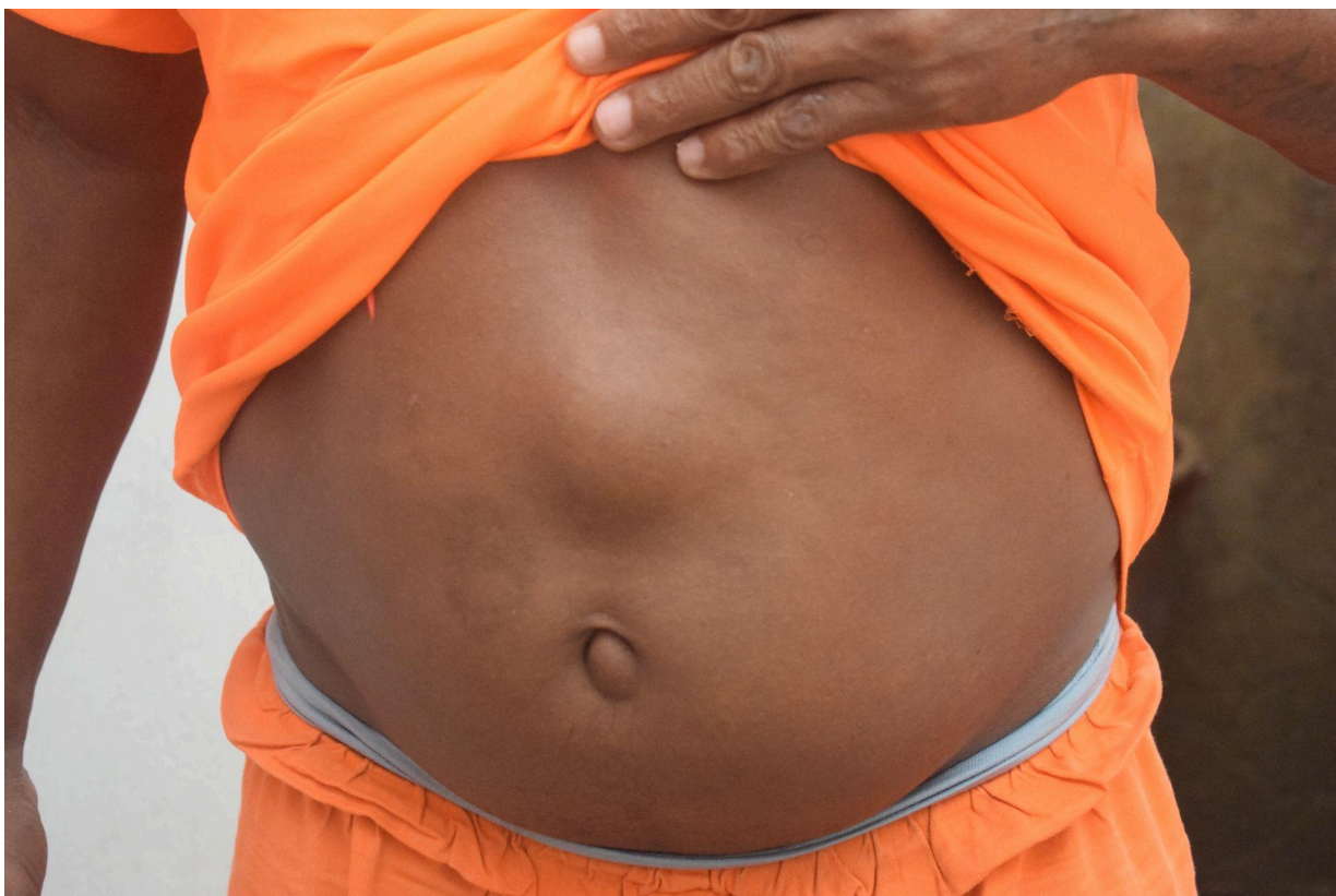
Figura 01 – Interno apresentando nódulo aparente na região abdominal, demandando acompanhamento pela equipe de saúde e avaliação médica especializada para investigação diagnóstica e eventual necessidade de tratamento cirúrgico.

Figura 02 – Pessoa privada de liberdade apresentando lesões dermatológicas em membros inferiores, compatíveis com afecção cutânea que demanda avaliação e acompanhamento pela equipe de saúde da unidade.