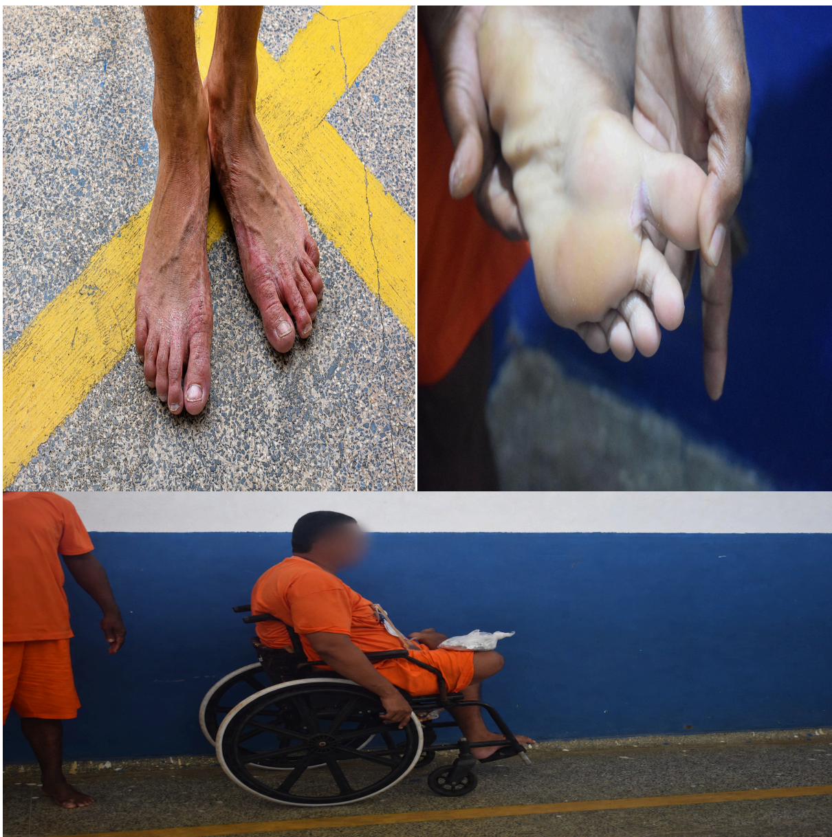
Figura 04 – Pessoa privada de liberdade com deficiência física, usuária de cadeira de rodas, observada durante a inspeção. Na mesma imagem, também são visíveis lesões dermatológicas em membros inferiores, indicando a necessidade de acompanhamento contínuo pela equipe de saúde e atenção às condições de acessibilidade e cuidados específicos relacionados à sua condição.