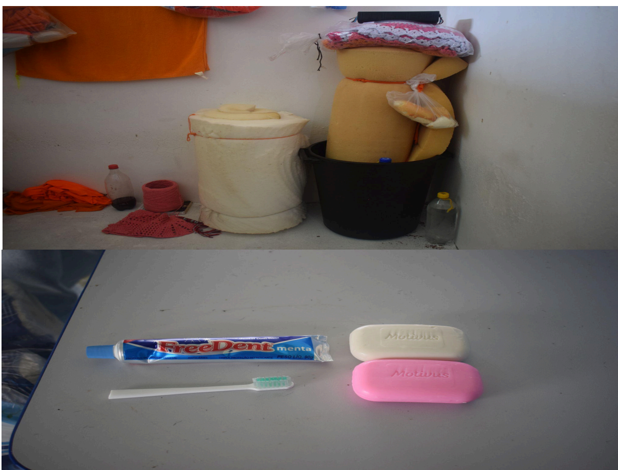
Figura 08 – Imagens dos colchões utilizados pela população custodiada e dos produtos de higiene pessoal disponibilizados pela unidade prisional. O registro tem por finalidade demonstrar as condições dos itens fornecidos aos internos, bem como os insumos destinados à manutenção da higiene pessoal e das condições mínimas de dignidade no ambiente de custódia.

■ legislação de execução penal, sendo dever do Estado assegurar ambiente compatível com a proteção da saúde e da integridade física das pessoas privadas de liberdade.