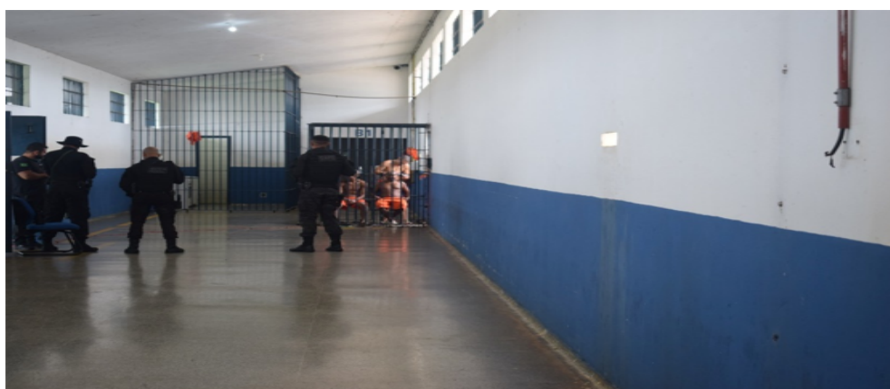
Figura 09 – Pessoas privadas de liberdade durante a realização de corte de cabelo nas dependências da unidade prisional.

Embora não tenham sido identificadas evidências de transmissão de doenças decorrentes dessa prática, os relatos indicam risco sanitário potencial, agravado pela ausência de protocolos formais de biossegurança. Diante disso, o MEPCT/RO considera necessária a adoção de procedimentos padronizados de higienização e desinfecção dos equipamentos após cada utilização, bem como o fornecimento de insumos adequados e orientações técnicas aos responsáveis pelos cortes, visando à promoção da saúde e à prevenção de agravos no ambiente prisional.