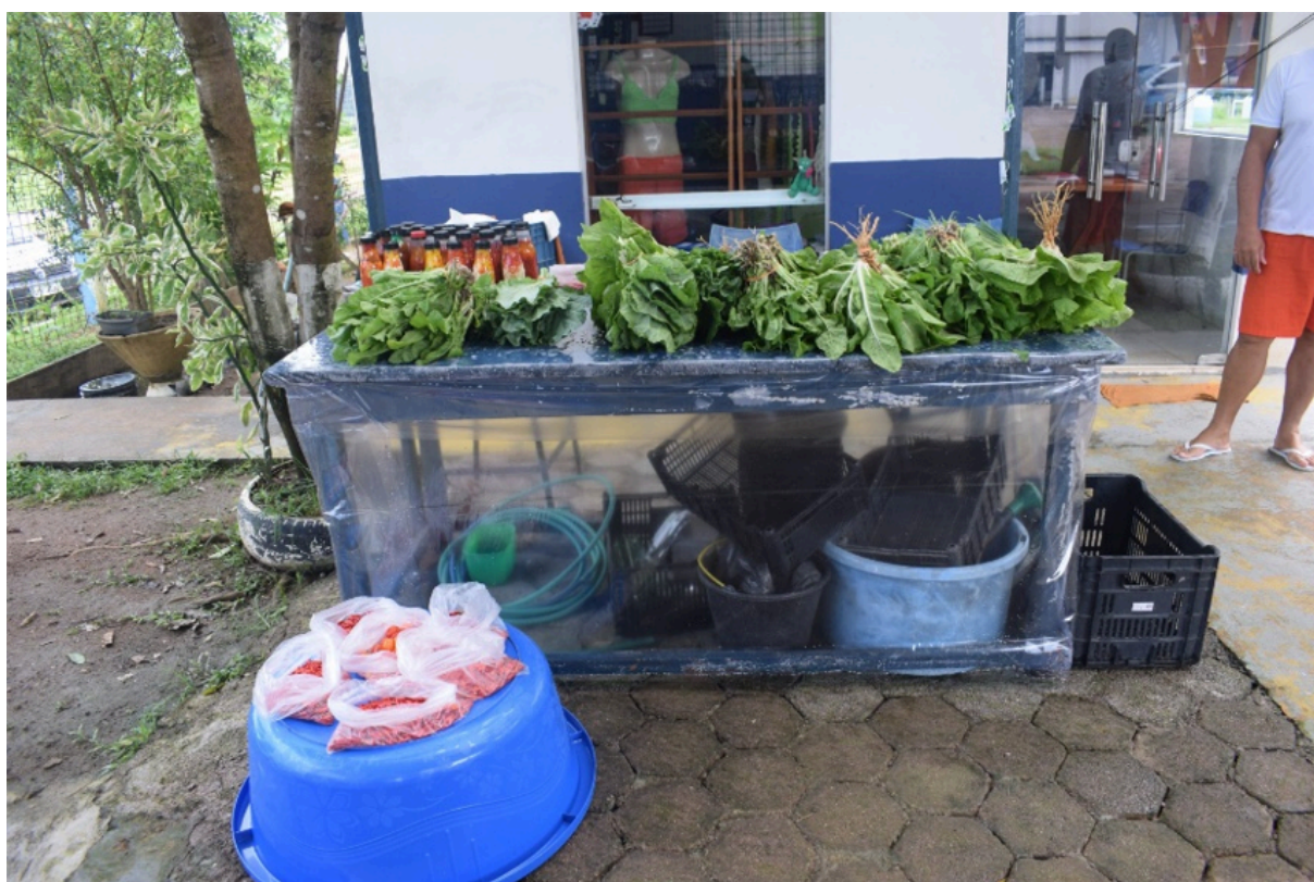
Figura 12 – Imagem das hortaliças cultivadas na horta da unidade prisional, atividade que contribui para o desenvolvimento de práticas laborais e ações de ressocialização das pessoas privadas de liberdade, promovendo ocupação produtiva e incentivo a habilidades de cultivo e manutenção agrícola.

A horta desenvolvida pelos custodiados constitui iniciativa que promove trabalho, aprendizado, responsabilidade, desenvolvimento de habilidades e fortalecimento dos processos de ressocialização, representando experiência positiva de valorização da pessoa privada de liberdade e de incentivo à reintegração social.