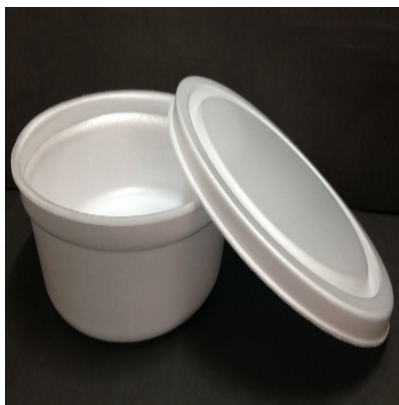
*Imagens meramente ilustrativas.

11.15. Além da bandeja de isopor, deverá acompanhar o “marmitex”: talheres descartáveis e frutas embaladas individualmente, bem como atender criteriosamente as descrições abaixo: