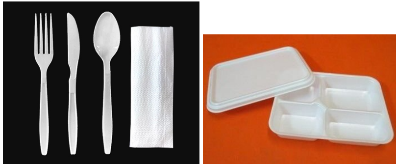
*Imagens meramente ilustrativas.

11.14. O restaurante deverá fornecer a alimentação de que trata este instrumento acondicionado em recipiente próprio para consumo, de acordo com as imagens e descritivos a seguir: