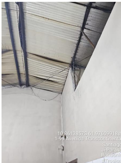
Imagens 23 e 24 – Área de preparo e manipulação.