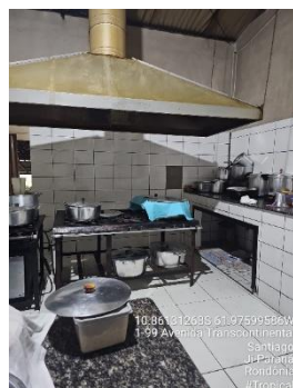
Imagens 25 – Área de Preparo e manipulação

Solução: Providenciar o fechamento adequado das caixas de tomada, com instalação de espelhos e proteção dos pontos elétricos. Regularizar a fiação exposta no teto, mediante embutimento ou acondicionamento em eletrodutos/tubulações apropriadas, devidamente fixados e íntegros. As adequações devem garantir segurança, organização das instalações e superfícies que permitam adequada higienização, em conformidade com a RDC 216/2004.