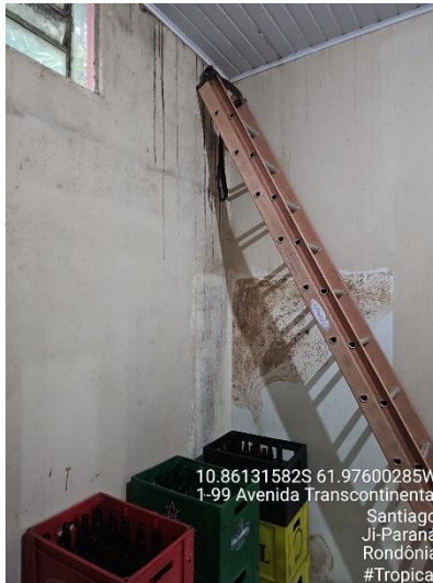
Imagens 21 e 22 – Área de preparo, manipulação e armazenamento.