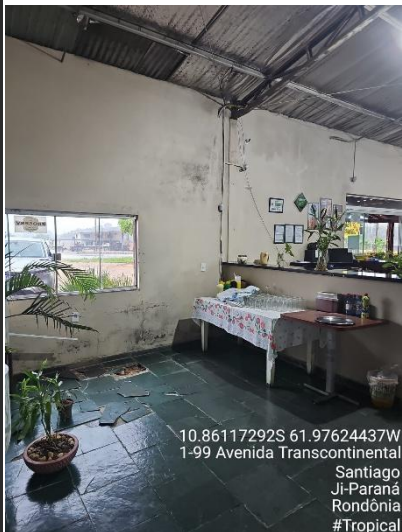
Imagens 01, 02, 03, 04, 05 e 06 – Imagens gerais dos ambientes

10.86117292S 61.97624437W 1-99 Avenida Transcontinental Santiago Ji-Paraná Rondônia #Tropical