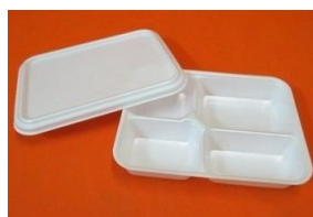
*Imagens meramente ilustrativas.

11.15. Além da bandeja de isopor, deverá acompanhar o "marmitex": talheres descartáveis e frutas embaladas individualmente, conforme especificado no item 11.18 deste Termo, bem como atender criteriosamente as descrições abaixo: