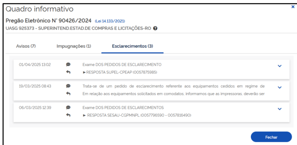
Figura 2 – Quadro informativo. Disponível em: https://cnetmobile.estaleiro.serpro.gov.br/comprasnet-web/seguro/fornecedor/acompanhamento-compra/item/-1?compra=92537305904262024 .

Inclusive, conforme quadro acima, destacamos novamente o “Exame dos Pedidos de Esclarecimentos” divulgado no dia 06/03/2025, às 12:39, no sistema em comento, cujos esclarecimentos que expusemos acima foram devidamente respondidos e divulgados.