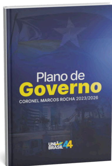
Plano de Governo Coronel Marcos Rocha 2023 – 2026