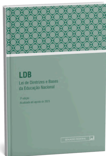
LDB – Lei de Diretrizes e Bases da Educação Nacional