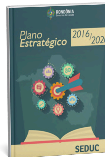
Plano Estratégico/Seduc 2016 – 2020