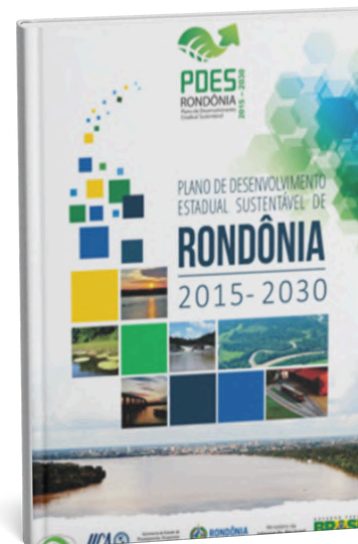
Plano de Desenvolvimento Estadual Sustentável de Rondônia 2015 – 2030