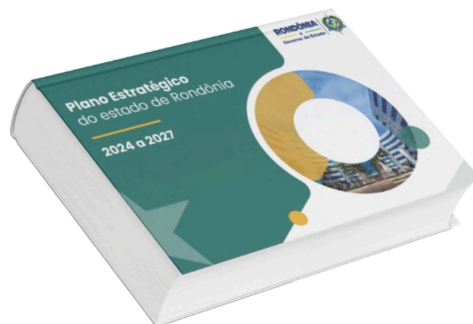
Plano Estratégico do Estado de Rondônia 2024 – 2027