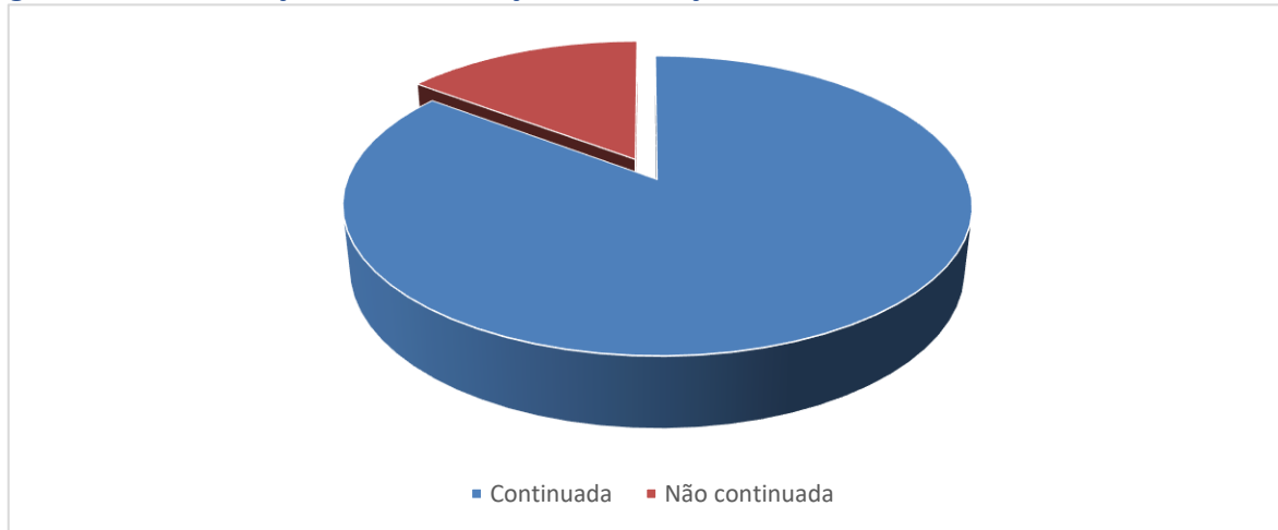
gráfico 3: Classificação das contratações de serviços

continuadas e 14,74% não continuadas dos recursos orçamentários deste grupo, serão destinados a serviços de natureza continuada , correspondente a um valor total estimado de R$ 8.019.368,00.