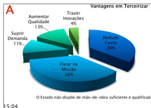
Figura 1: Gráfico mundial de Outsourcing demonstrando “Porque Terceirizar” como primeira alternativa da Administração e a mais viável.

4.5.3. Na opção por este formato de contratação, deve-se considerar que hoje terceirização ou outsourcing é usado em larga escala por grandes corporações e Governos, visando à redução de custos e o aumento da qualidade. Porém, a terceirização deve estar em conformidade com os objetivos estratégicos da organização, os quais irão revelar em que pontos ela poderá alcançar resultados satisfatórios, respeitando sempre os princípios da Administração Pública, em especial, os princípios da legalidade e eficiência, primando também pela economicidade no trato com o erário, respeitando o interesse e a relevância para a sociedade.