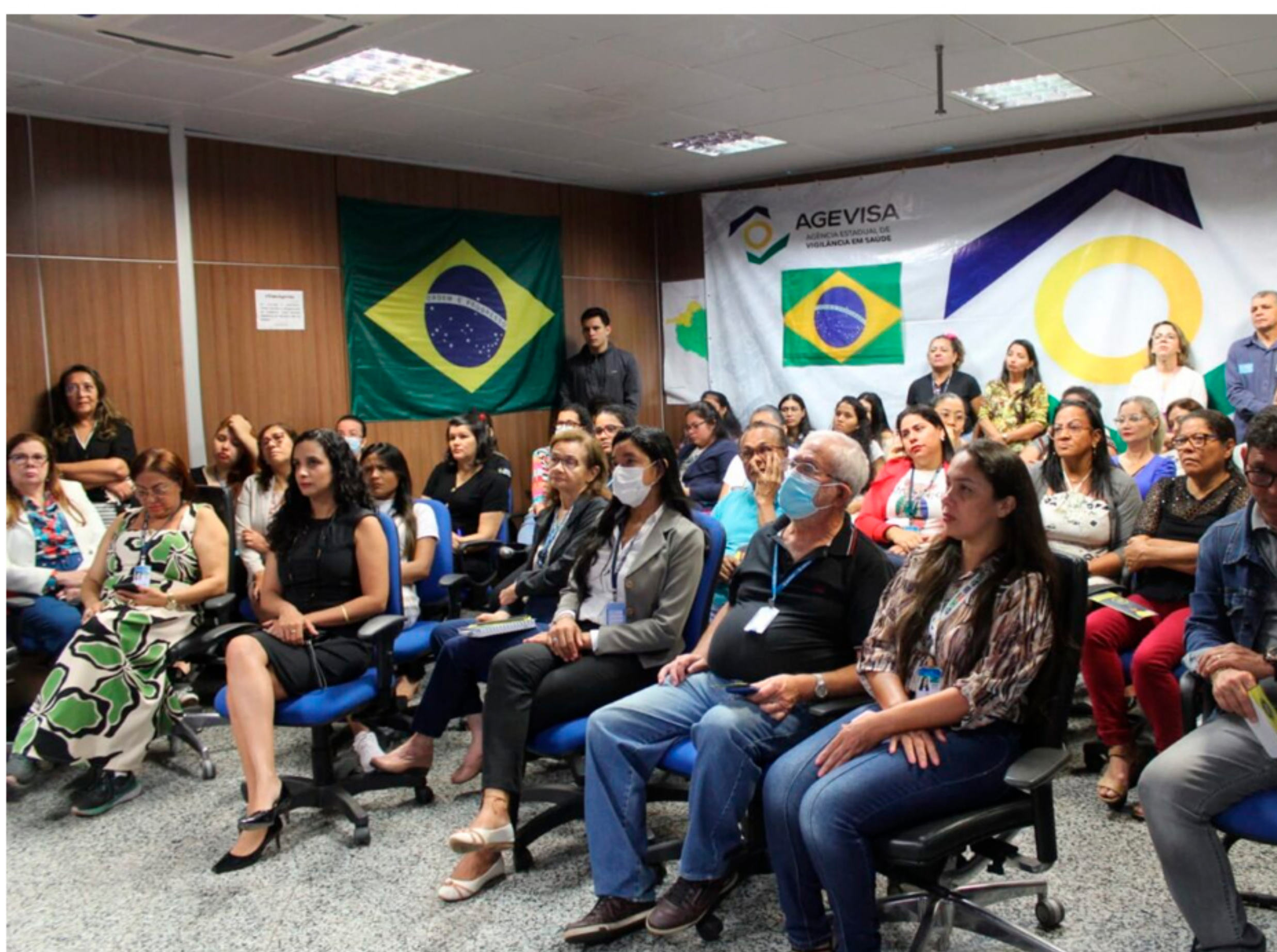
Roda de conversa contra assédio moral e sexual realizada pela Agência de Estadual de Vigilância em Saúde de Rondônia - Agevisa com participação da Ouvidoria-Geral em 17/05/2023.