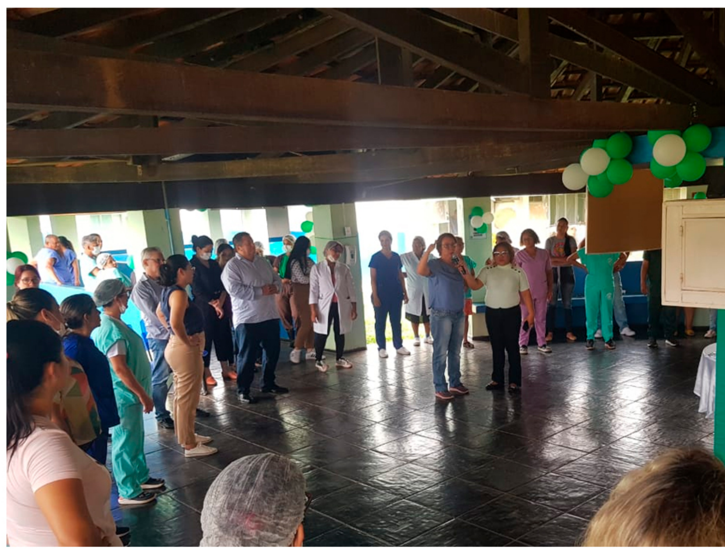
Palestra sobre prevenção e combate ao assédio moral, direcionada aos servidores do Centro de Medicina Tropical de Rondônia - Cemetron em 05/12/2023.