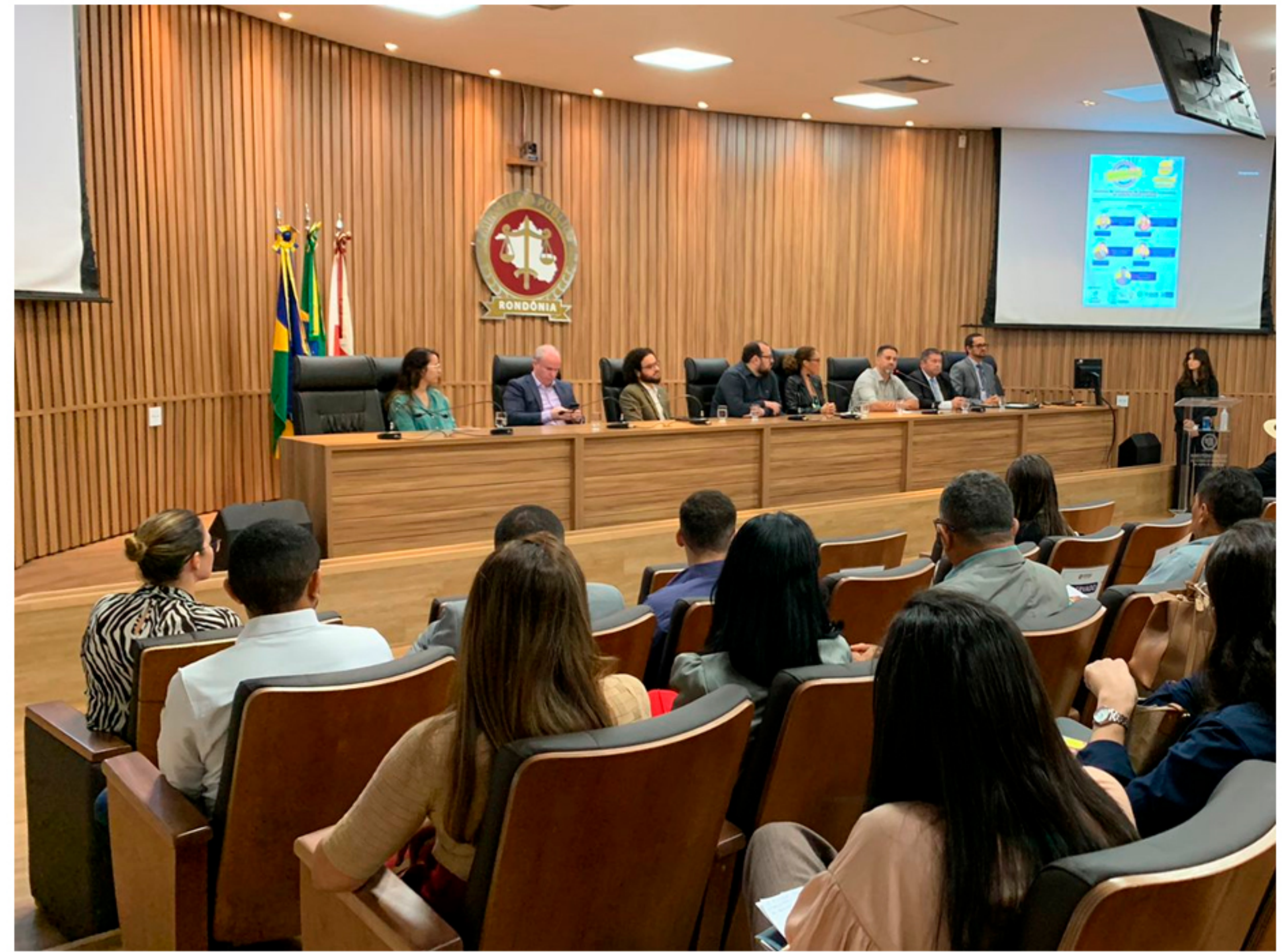
Campanha “É proibido ser assediador” realizada no Ministério Público do Estado - MP/RO em 09/05/2023.