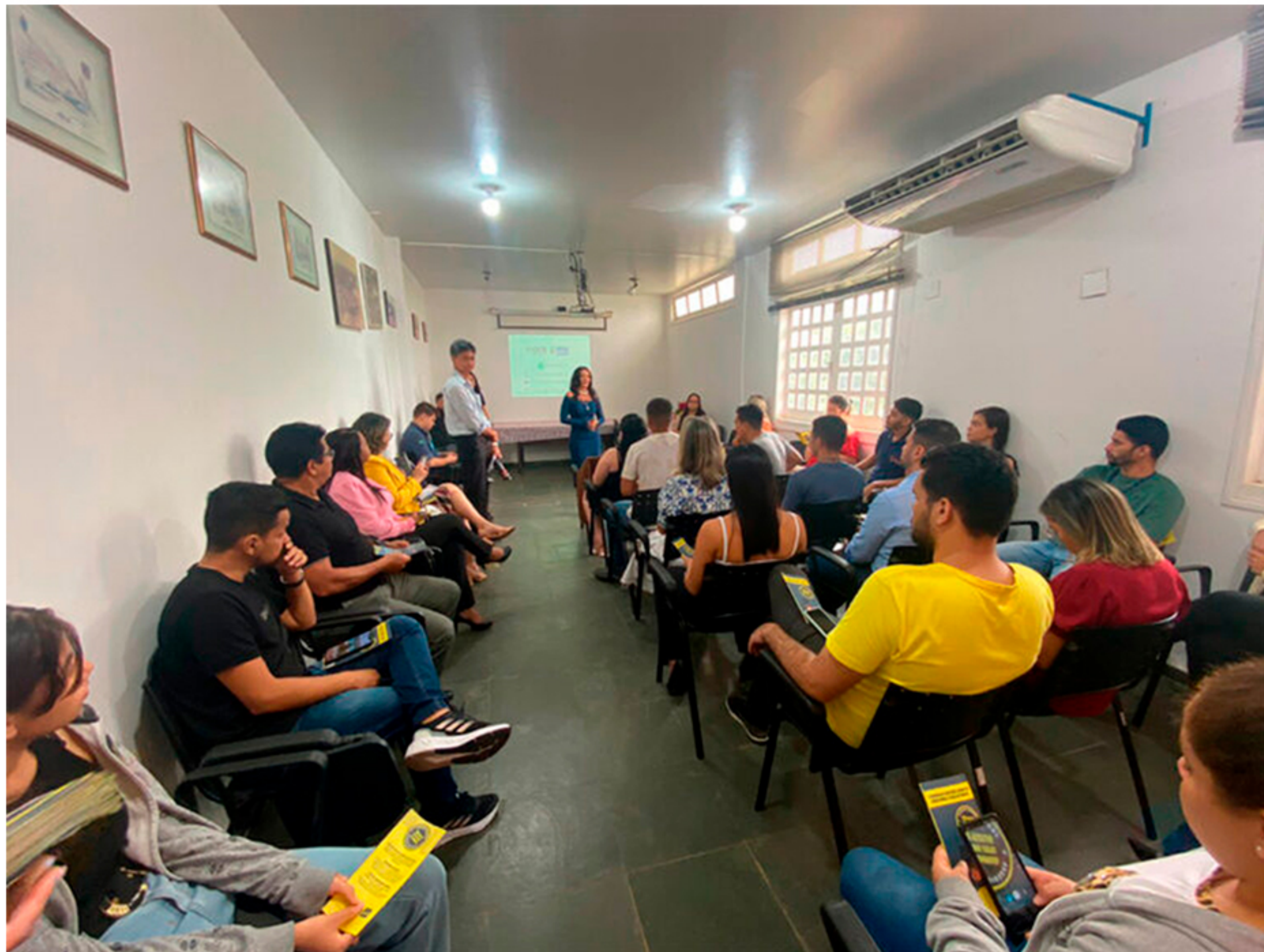
Campanha realizada na Sociedade de Portos e Hidrovias do Estado – SOPH em 28/03/2023.

Durante o ano de 2023, a Ouvidoria-Geral do Estado em parceria com as ouvidorias do Poder Executivo, desenvolveu diversas Campanhas de Prevenção e Combate ao Assédio Moral e Sexual, com o objetivo de conscientizar os servidores e os gestores, sobre a importância de reconhecer o problema, bem como as formas de prevenção da prática de assédio.