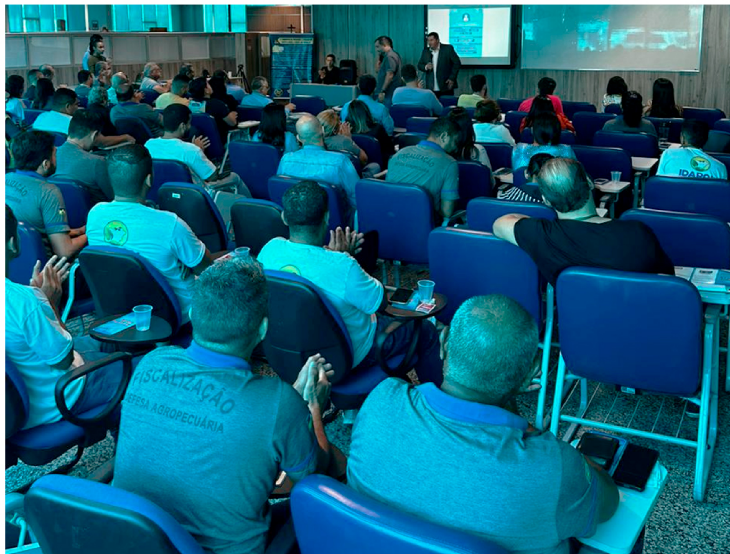
palestra sobre prevenção e combate ao assédio moral e sexual no trabalho, direcionada aos servidores da Agência Sanitária Agrosilvopastoril do Estado de Rondônia - Idaron em 25/09/2023.