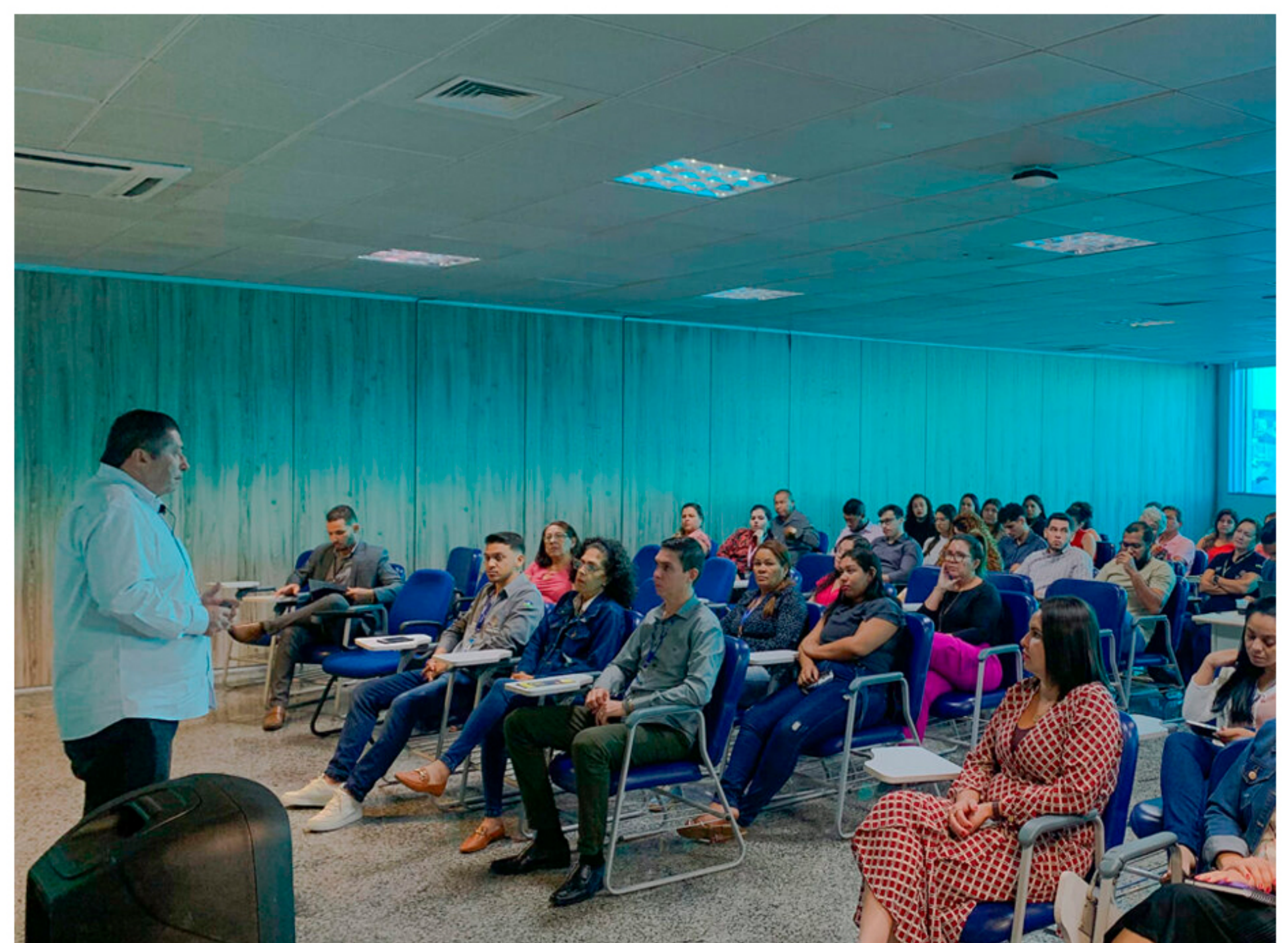
Palestra sobre prevenção e combate ao assédio moral e sexual no trabalho, direcionada aos servidores da Secretaria de Planejamento, Orçamento e Gestão – Sepog em 26/07/2023.