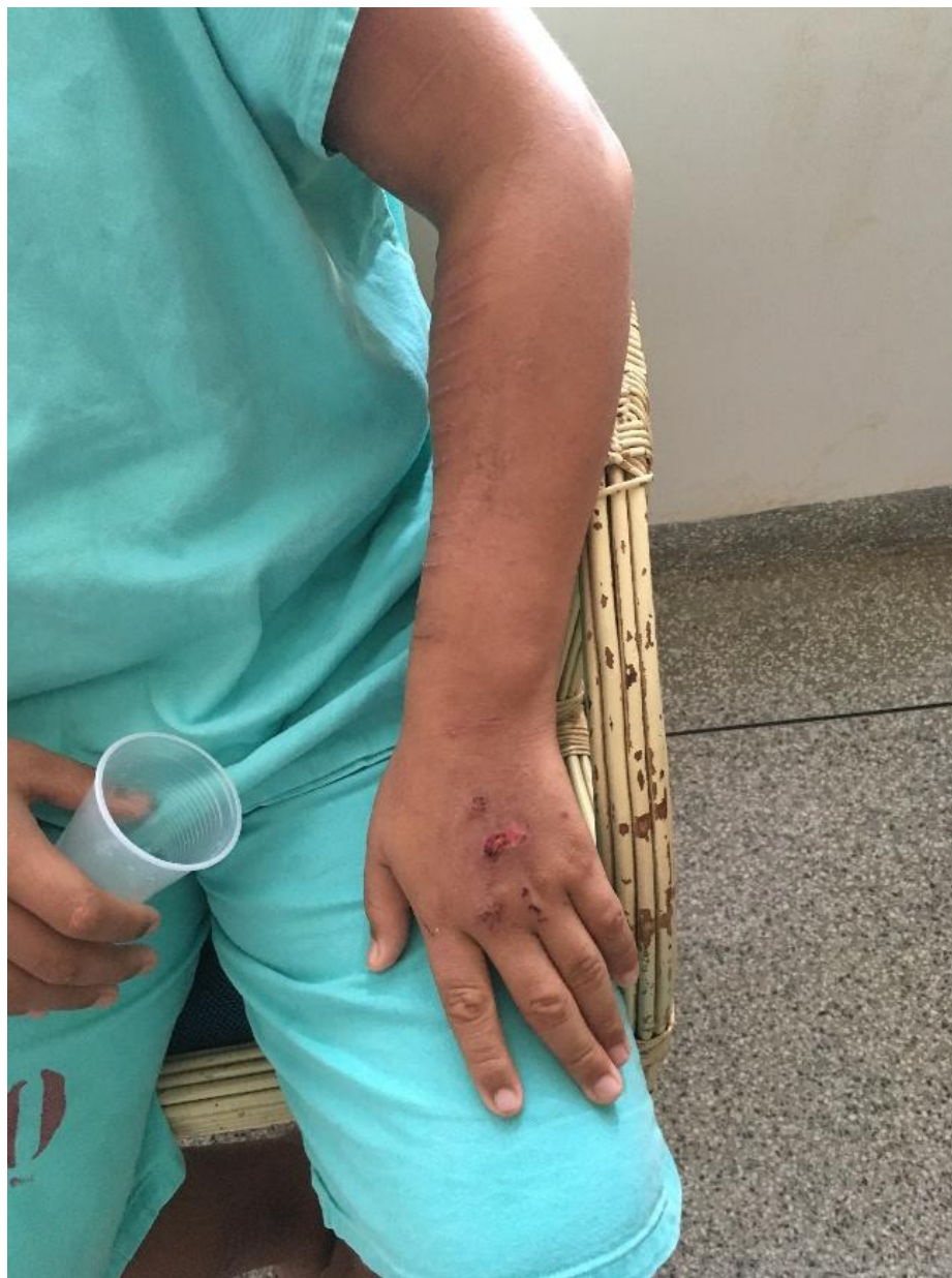
Figura 4 - Automutilação - 3 -

ESTADO DE RONDÔNIA SECRETARIA ESTADUAL DE ASSISTÊNCIA E DO DESENVOLVIMENTO SOCIAL - SEAS MECANISMO ESTADUAL DE PREVENÇÃO E COMBATE À TORTURA