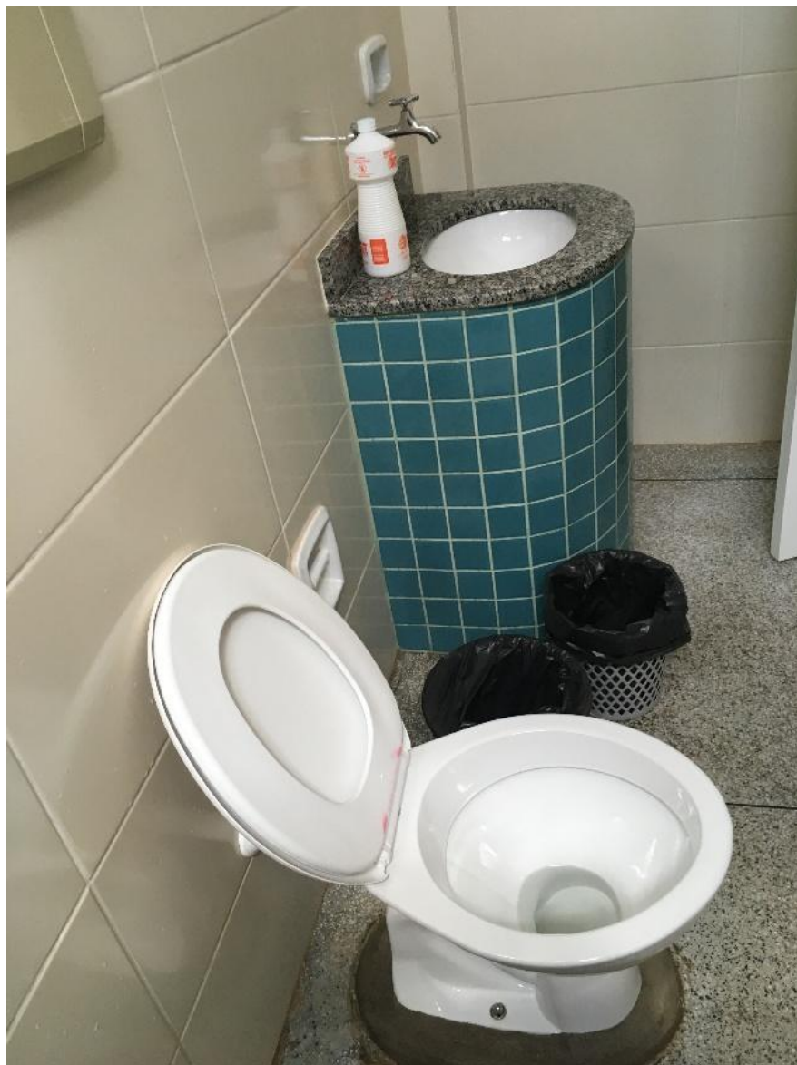
Figura 5 - Banheiro do quarto do adolescente no Hospital de Base.

ESTADO DE RONDÔNIA SECRETARIA ESTADUAL DE ASSISTÊNCIA E DO DESENVOLVIMENTO SOCIAL - SEAS MECANISMO ESTADUAL DE PREVENÇÃO E COMBATE À TORTURA