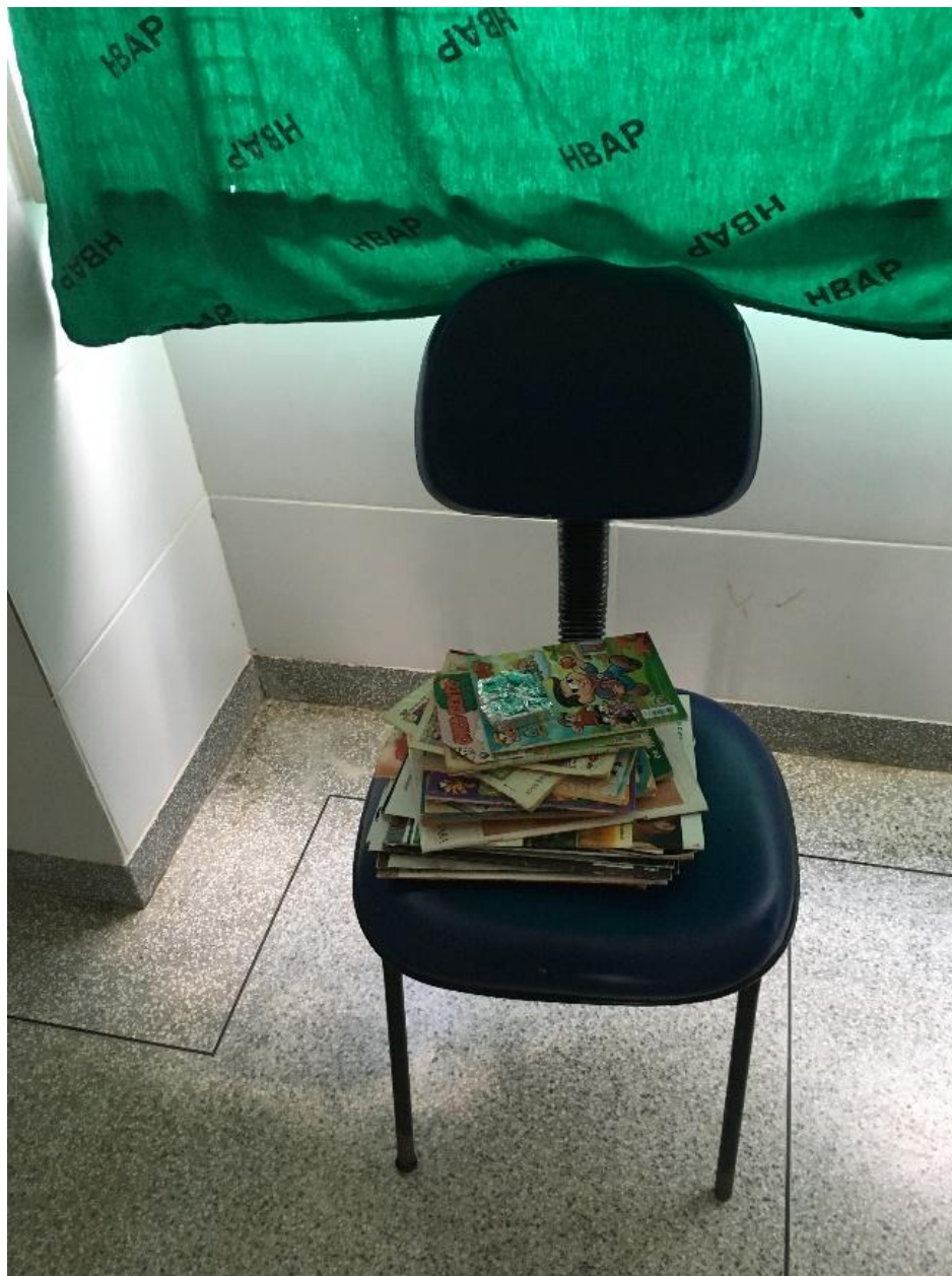
Figura 7 - Única atividade proposta ao adolescente no hospital: leitura de gibis

ESTADO DE RONDÔNIA SECRETARIA ESTADUAL DE ASSISTÊNCIA E DO DESENVOLVIMENTO SOCIAL - SEAS MECANISMO ESTADUAL DE PREVENÇÃO E COMBATE À TORTURA