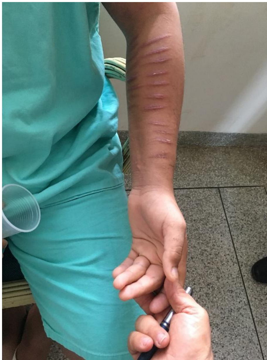
Figura 3 - Automutilação -2-

ESTADO DE RONDÔNIA SECRETARIA ESTADUAL DE ASSISTÊNCIA E DO DESENVOLVIMENTO SOCIAL - SEAS MECANISMO ESTADUAL DE PREVENÇÃO E COMBATE À TORTURA