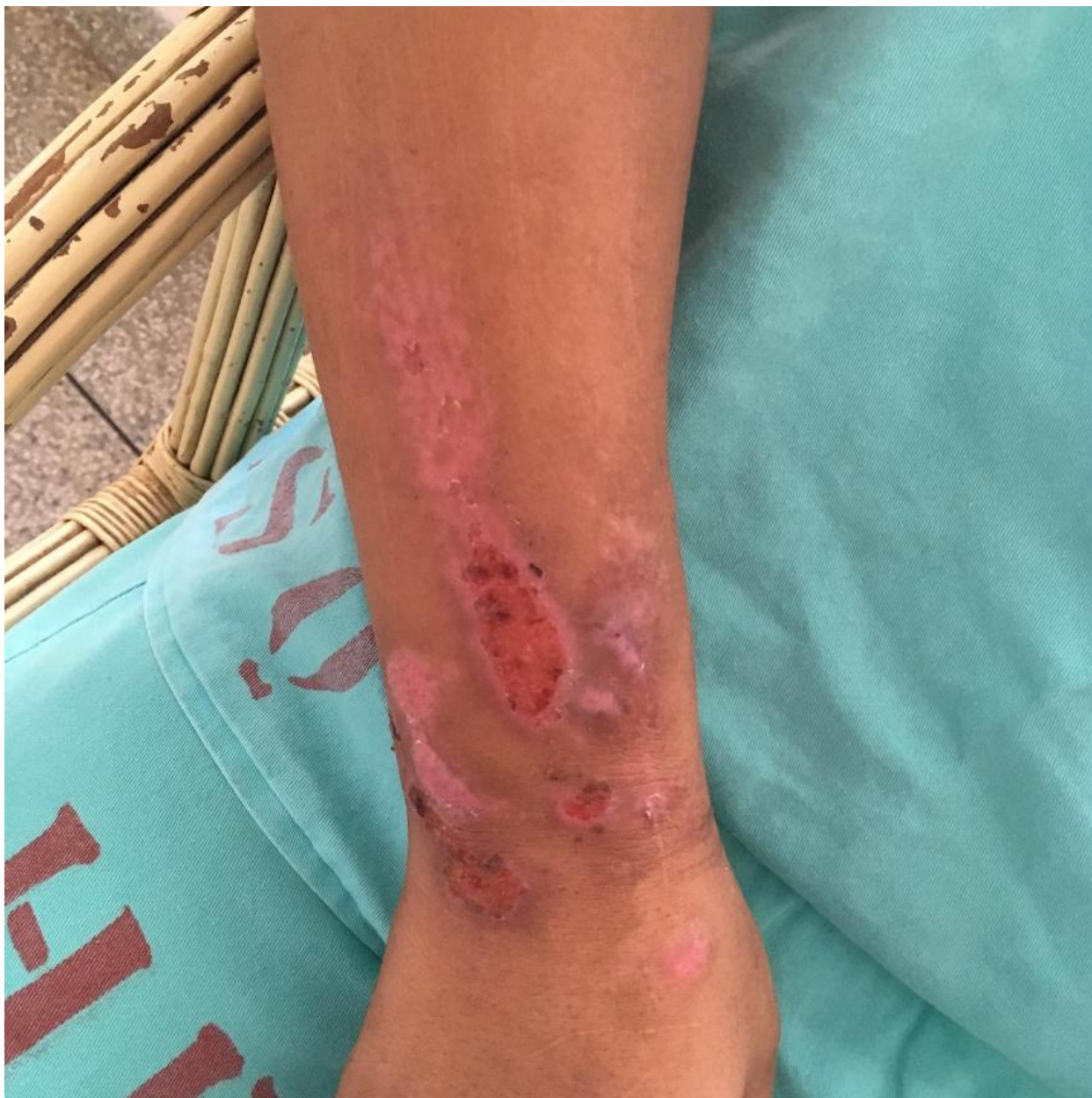
Figura 2 Automutilação - 1 -

ESTADO DE RONDÔNIA SECRETARIA ESTADUAL DE ASSISTÊNCIA E DO DESENVOLVIMENTO SOCIAL - SEAS MECANISMO ESTADUAL DE PREVENÇÃO E COMBATE À TORTURA