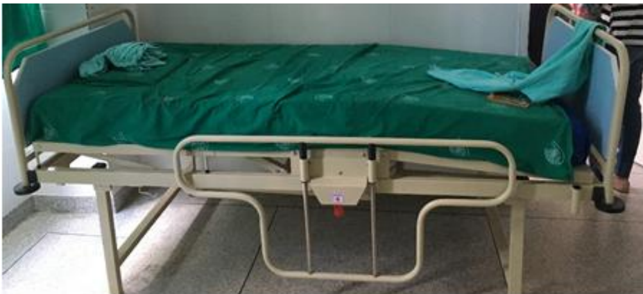
Figura 8 - Leito de uso do adolescente

ESTADO DE RONDÔNIA SECRETARIA ESTADUAL DE ASSISTÊNCIA E DO DESENVOLVIMENTO SOCIAL - SEAS MECANISMO ESTADUAL DE PREVENÇÃO E COMBATE À TORTURA