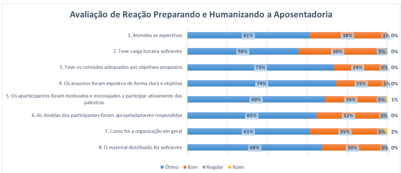
Gráfico 1 – Reação dos participantes do Preparando e Humanizando a Aposentadoria