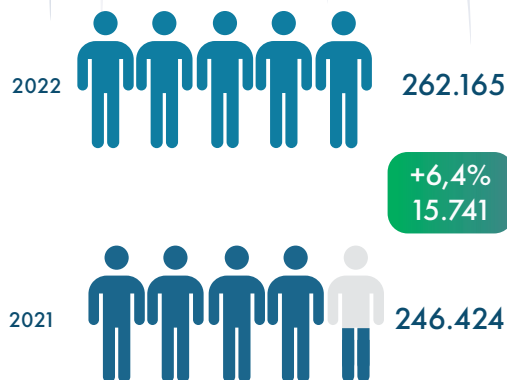
COMPARATIVO DE ESTOQUES

Observação: estoque de empregos é o número de empregos formais tanto no privado quanto no público