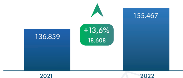
COMPARATIVO NO Nº ADMISSÕES

Rondônia cria 155,5 mil de empregos formais em 2022, 13% a mais que no ano anterior