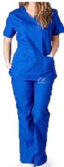
Figura: Conjunto Cirúrgico