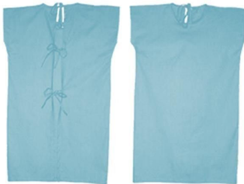
Figura : Camisola adulto aberta atrás