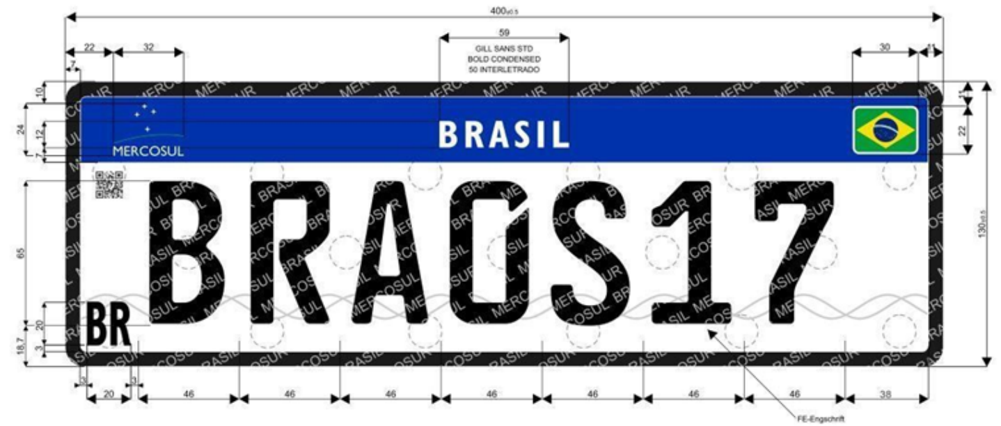
FIGURA I - PLACA DE VEÍCULOS

40.1. Fica eleito o Foro da Comarca de Porto Velho, Capital do Estado de Rondônia, para dirimir todas e quaisquer questões oriundas do presente ajuste, inclusive às questões entre a empresa CONTRATADA e a CONTRATANTE, decorrentes desta aquisição.