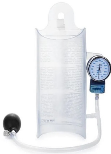
Conforme foto abaixo, podemos observar, que é possível a visualização do frasco de soro (motivo esse, que fez com que a recorrida tivesse parecer DESFAVORÁVEL):

Nota-se que o material ofertado atende os requisitos do edital, entretanto, a análise do produto se deu apenas pela ficha técnica, sem analisar o material de fato. Sendo que, o produto é de boa qualidade, atende ao solicitado e possui custo viável à instituição. Apenas pela ficha técnica, entedemos que fica difícil apurar com clareza a qualidade do material. Conforme foto abaixo, podemos observar, que é possível a visualização do frasco de soro (motivo esse, que fez com que a recorrida tivesse parecer DESFAVORÁVEL):