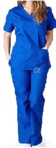
Figura: Conjunto Cirúrgico