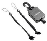
Garmin Retractable Lanyard for Select GPS Devices