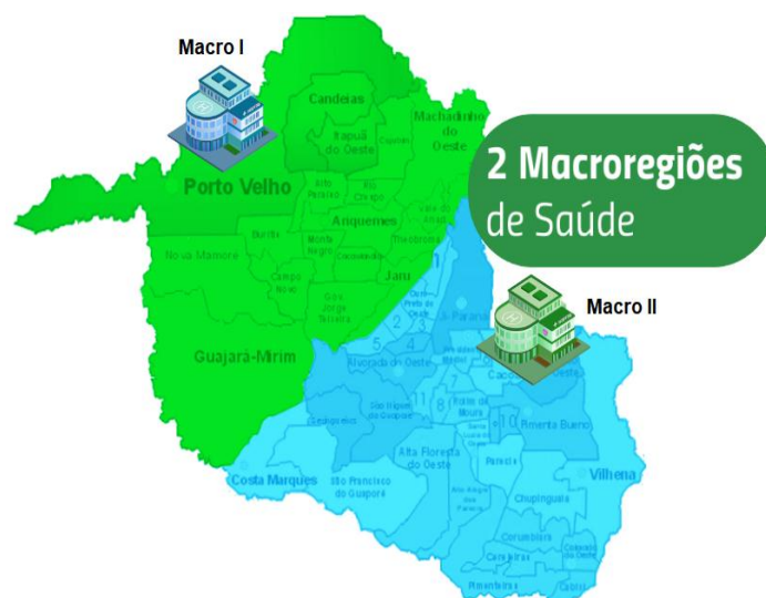
Macro Regiões Hospitalares

- Matriz de Categorização: Diagrama entre os fatores Ameaça x Vulnerabilidade, a que um dado município se enquadra.