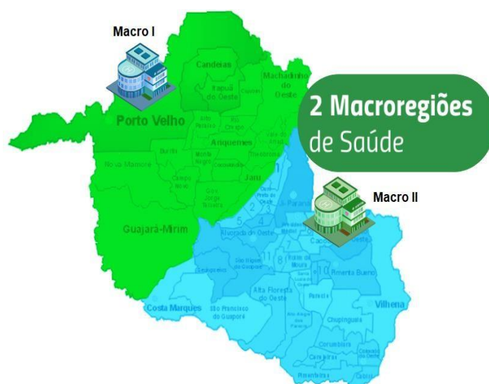
Macro Regiões Hospitalares

- Matriz de Categorização: Diagrama entre os fatores Ameaça x Vulnerabilidade, a que um dado município se enquadra.