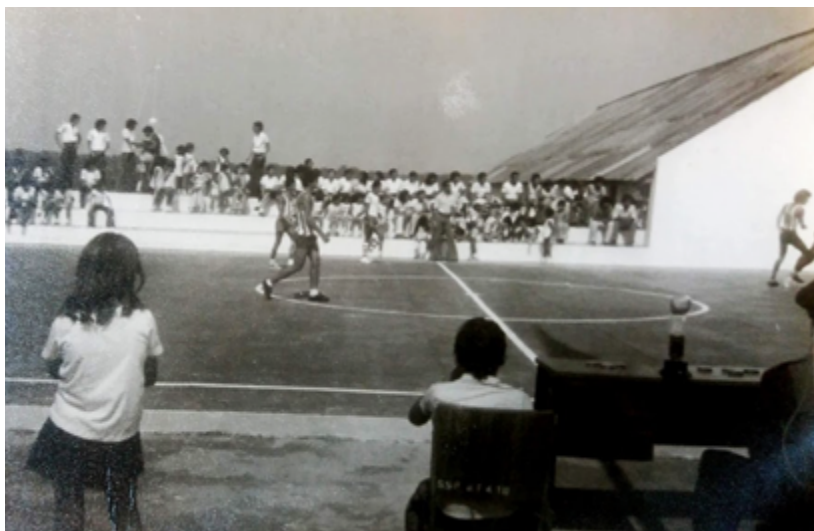
Quadra Poliesportiva da GT (1975).