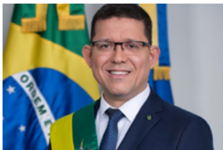
MARCOS JOSÉ ROCHA DOS SANTOS EXCELENTÍSSIMO GOVERNADOR DO ESTADO DE RONDÔNIA

A memória de uma instituição é o fundamento para a manutenção de suas tradições, da confirmação do cumprimento das missões impostas aos seus integrantes e do fortalecimento do seu povo. Por fim, destaco ainda que a Polícia Militar de Rondônia é uma instituição que efetivamente faz parte da história do nosso Estado e de todos nós.