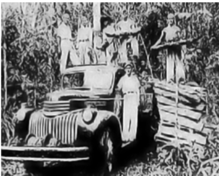
Guardas Territoriais coletando e transportando lenha para o abastecimento da EFMM e Usina de Luz de Guajará-Mirim (1947).