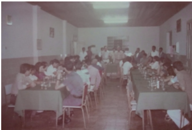
Restaurante de Oficiais no antigo Rancho da GT (1978).