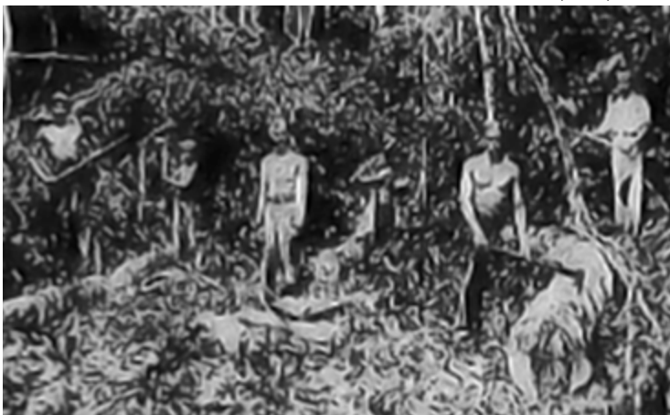
Guardas Territoriais desbravando a Floresta Amazônica (1947).