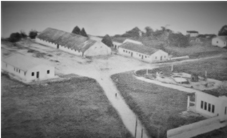
Quartel da Guarda Territorial no final da década de 1940.