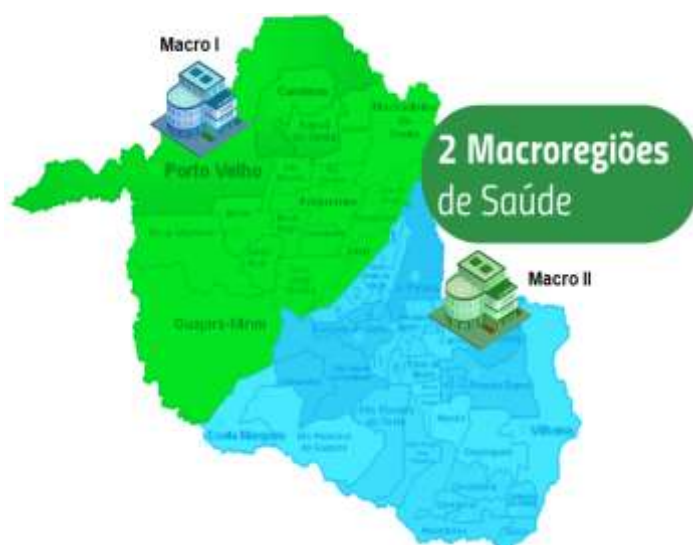
Macro Regiões Hospitalares

- Matriz de Categorização: Diagrama entre os fatores Ameaça x Vulnerabilidade, a que um dado município se enquadra.