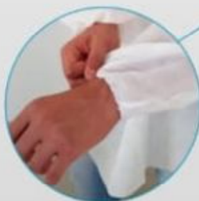
Punho com elástico

Tecido: TNT 100% polipropileno. SMS 100% polipropileno trilaminado com proteção microbiana. Laminado polipropileno com filme de polietileno garantindo 100% impermeabilidade