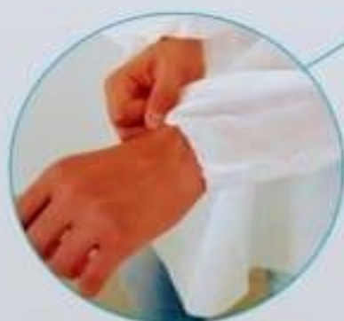
Punho com elástico