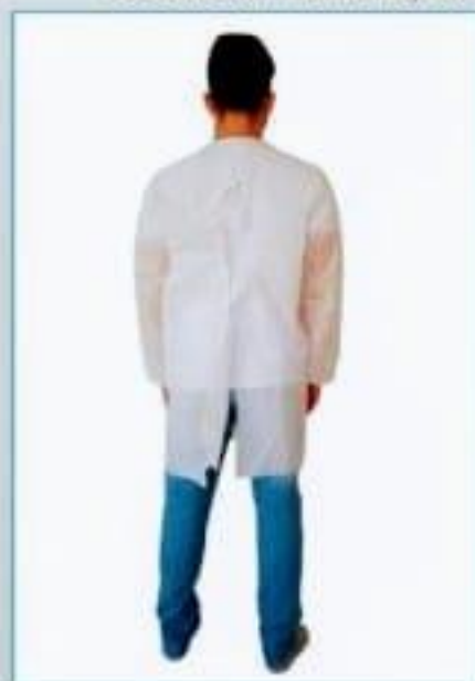
Costas com amarração