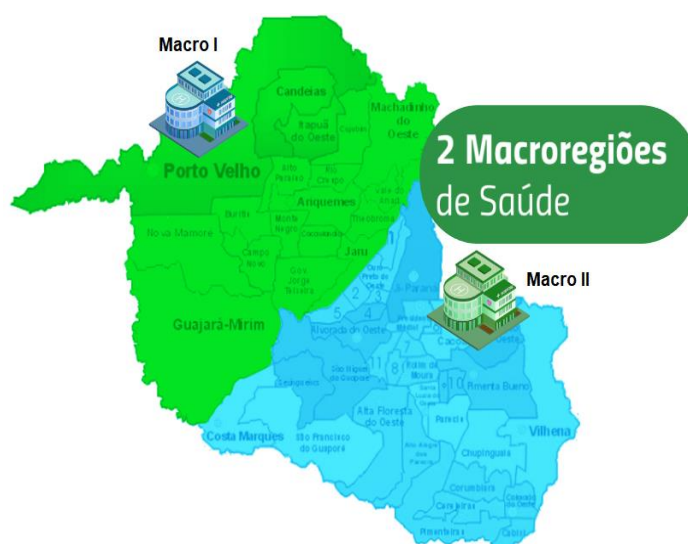
Macro Regiões Hospitalares

- Matriz de Categorização: Diagrama entre os fatores Ameaça x Vulnerabilidade, a que um dado município se enquadra.