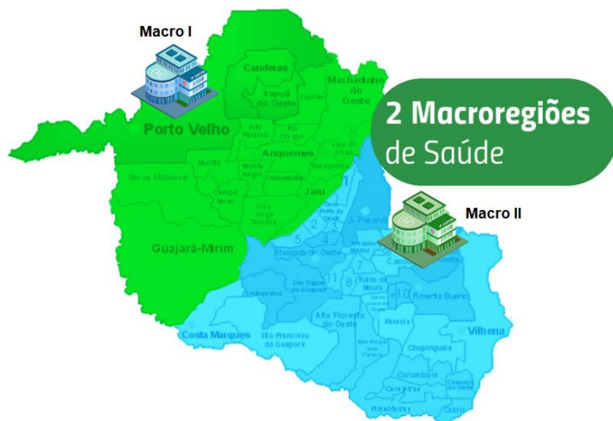
Macro Regiões Hospitalares

- Matriz de Categorização: Diagrama entre os fatores Ameaça x Vulnerabilidade, a que um dado município se enquadra.