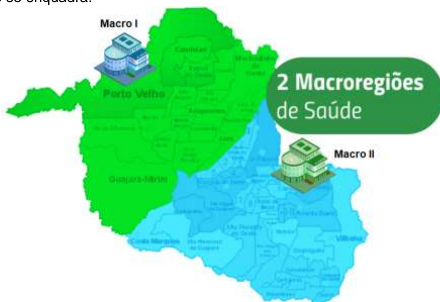
Macro Regiões Hospitalares

- Matriz de Categorização: Diagrama entre os fatores Ameaça x Vulnerabilidade, a que um dado município se enquadra.