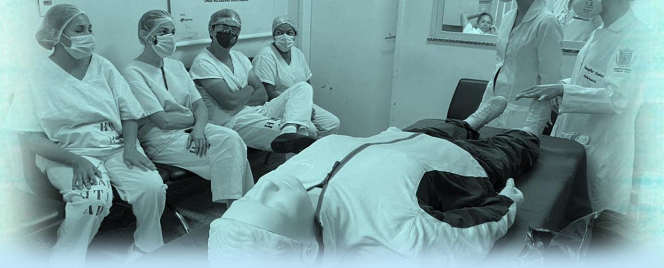
Treinamento na UTI do HBAP – Preparo do corpo em casos suspeitos e confirmados de COVID-19.

... E NO ATO DA INTERNAÇÃO NA UTI, A FAMILIA DEVE ENCAMINHAR-SE AO SABE E AO SERVIÇO SOCIAL, COM CÓPIAS DOS DOCUMENTOS PESSOAIS (RG, CN, COMPROVANTE DE RESIDÊNCIA); PARA PREENCHIMENTO DA FICHA DE INTERNAÇÃO (AM); CARTÃO DO SUS E FICHA SOCIAL. DOCUMENTOS OBRIGATORIOS NO ATO DA INTERNAÇÃO. ... PADRES E PASTORES DE DIFERENTES CONGREGAÇÕES DEVEM ENCAMINHAR-SE A CAPELANIA DO HÔ PARA ASSISTÊNCIA RELIGIOSA, ONDE RECEBERÃO ORIENTAÇÕES.