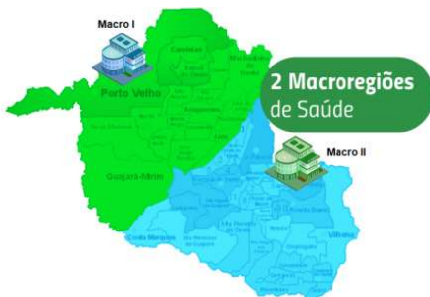
Macro Regiões Hospitalares