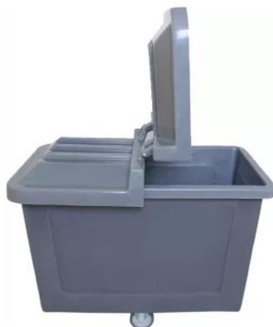
Carro Cuba 430 litros