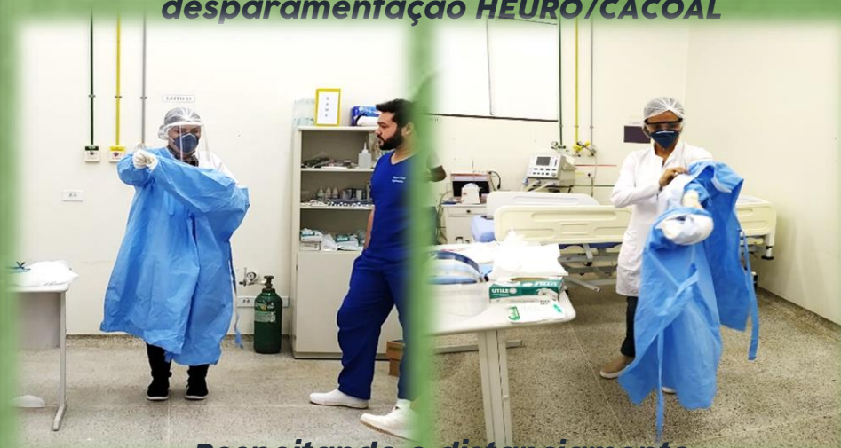
Respeitando o distanciamento Paramentação e desparamentação