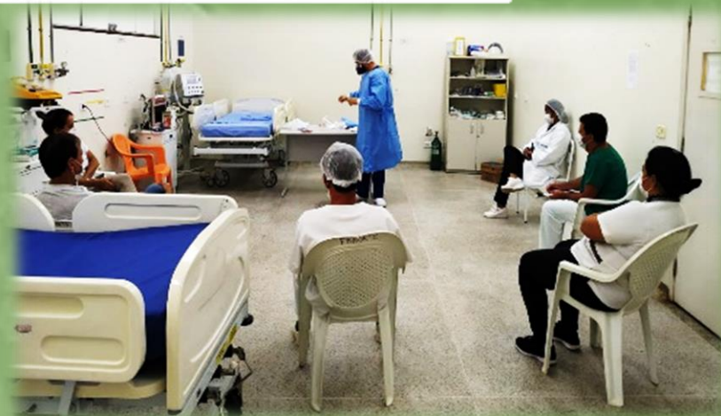
Prática de paramentação e desparamentação HEURO/CACOAL