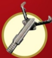
DENTE DE RATO COM JACARÉ