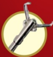
DENTE DE RATO