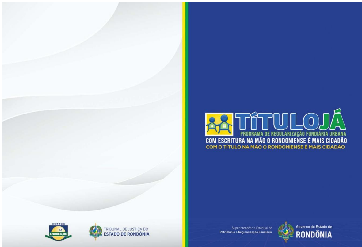
Arte gráfica do item 5 - CARTAZ