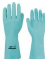
Luva Nitrílica sem forro Luvas Nitrílicas ( /produto/luva-nitrilica-sem-forro )