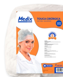
TOUCA CIRÚRGICA COM ANVISA