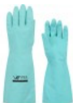
Luva Nitrílica Volk 40 Luvas Nitrílicas ( /produto/luva-nitrilica-volk-40 )