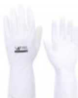
Luva Nitrílica sem forro branca Luvas Nitrílicas ( /produto/luva-nitrilica-sem-forro-branca )