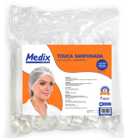
TOUCA SANFONADA COM ELÁSTICO - ANVISA