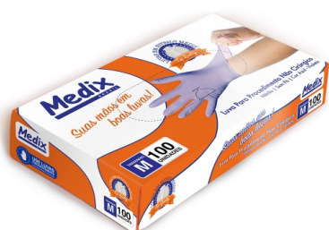
LUVA PARA PROCEDIMENTO NÃO CIRÚRGICO - ANVISA - AZUL-VIOLETA