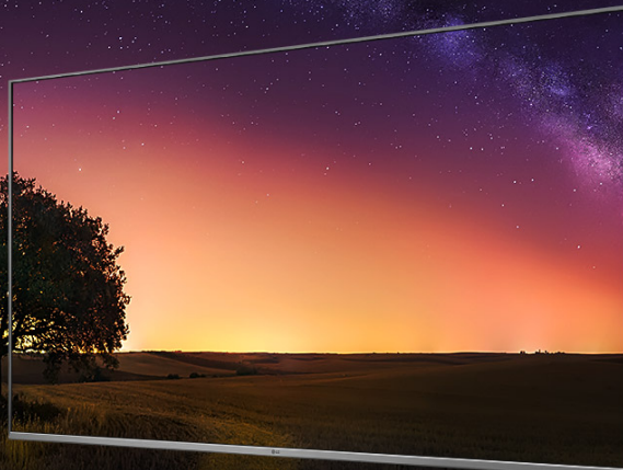
LG UHD AI TV

*O modelo convencional mencionado neste conteúdo refere-se a TVs sem tecnologia IPS, e as imagens são ilustrativas.