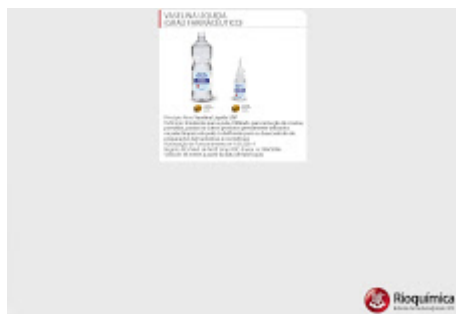
VASELINA LÍQUIDA.jpg 328K