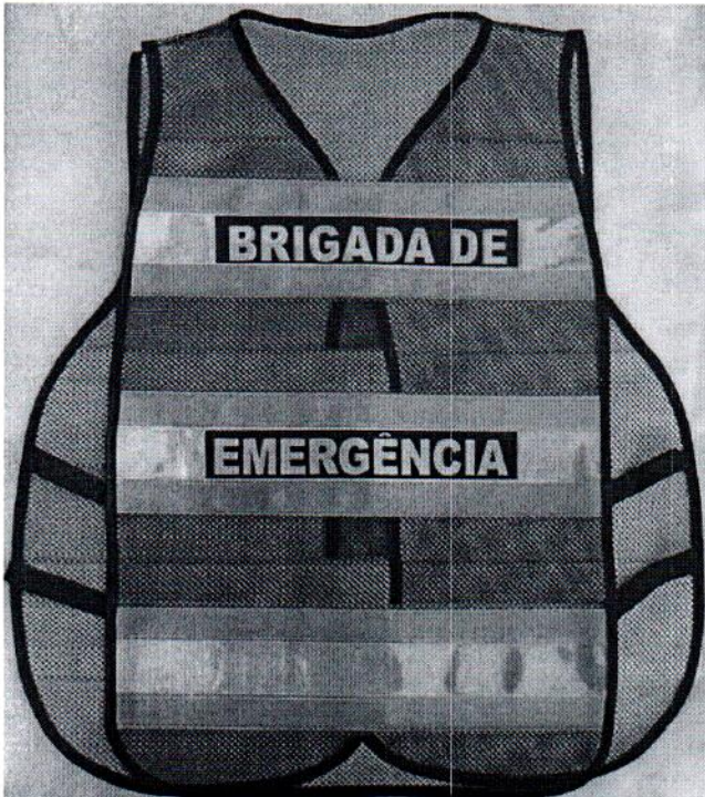
COSTAS DO COLETE