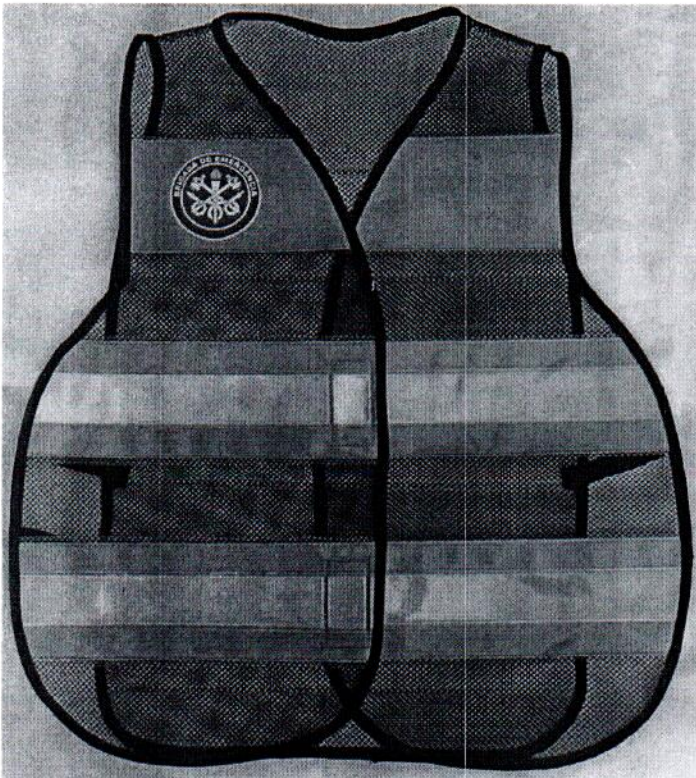
FRENTE DO COLETE