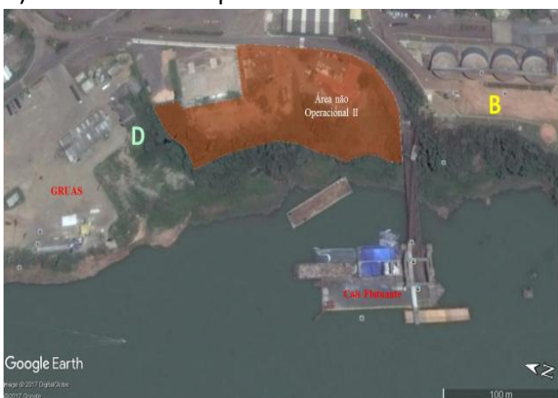
Figura 13 – Área Não Operacional II