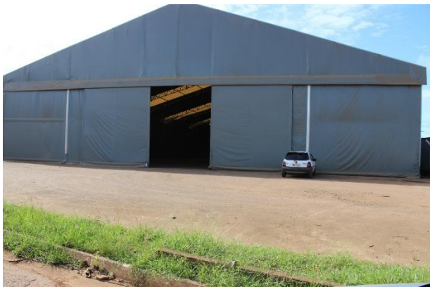
Figura 11 – Atuais Instalações no pátio 03