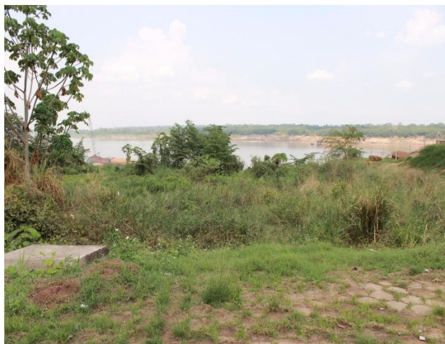
Figura 15 – Imagem Atual da Área Não Operacional