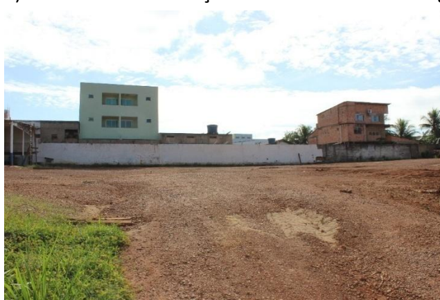
Figura 5 – Local Atual do Futuro Armazém Alfandegado