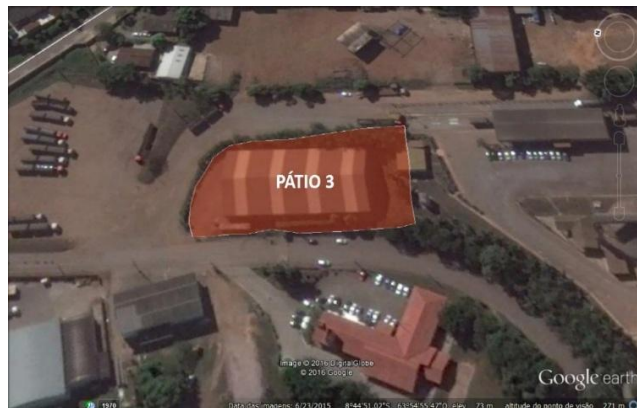
Figura 12 – Área atual do Pátio 03