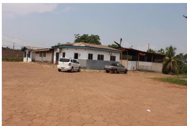
Figura 17 – Prédio Administrativos desocupados