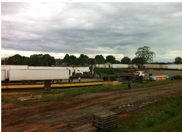
Figura 21 – Imagem Atual da Área Não Operacional