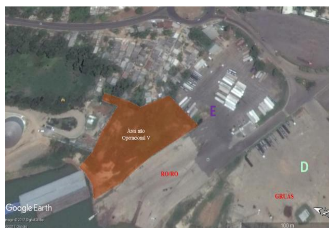
Figura 26 – Área Não Operacional V