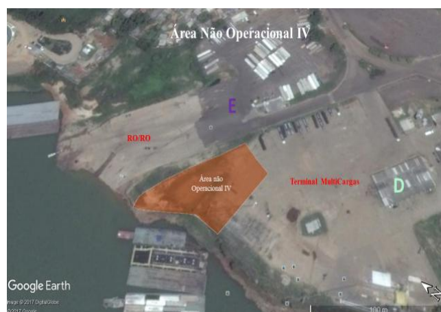
Figura 22 – Área Não Operacional IV