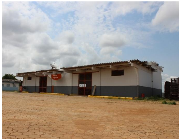
Figura 16 – Área Não Operacional III