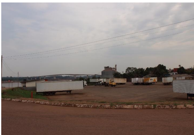
Figura 23 – Imagem Atual da Área Não Operacional