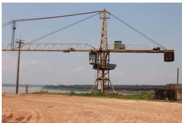
Figura 19 – Guindaste Grua Desativado