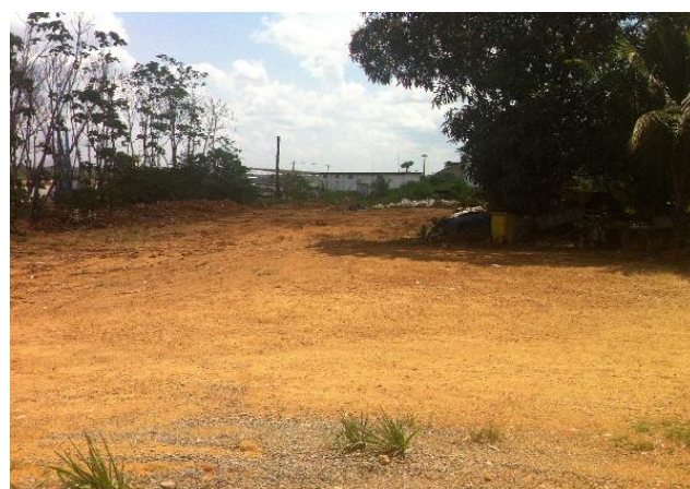
Figura 14 – Imagem Atual da Área Não Operacional