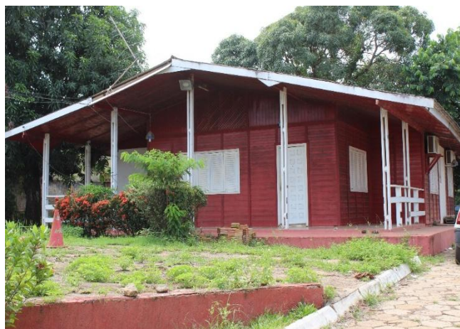
Figura 4 – Instalação Atual no Local do Futuro Prédio Administrativo