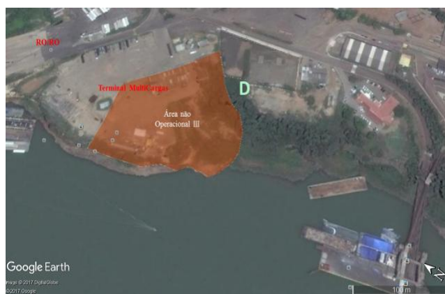
Figura 20 - Área Não Operacional III