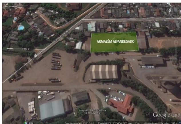
Figura 6 – Área do Futuro Armazém Alfandegado