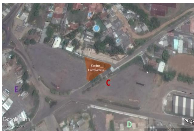
Figura 10 – Área atual do Centro de Convivência