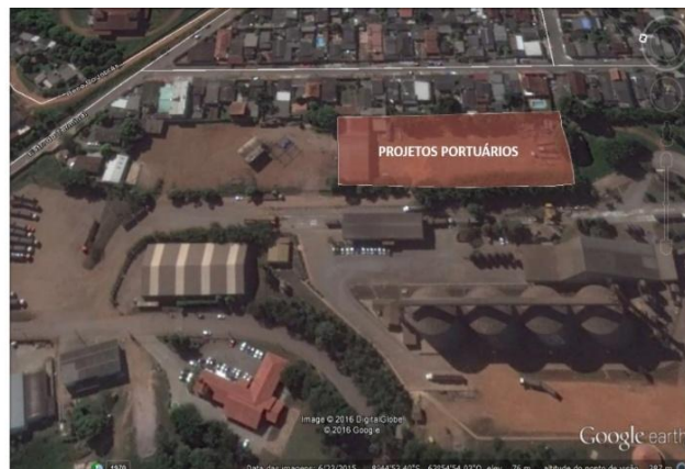
Figura 8 – Área da Área Não Operacional I