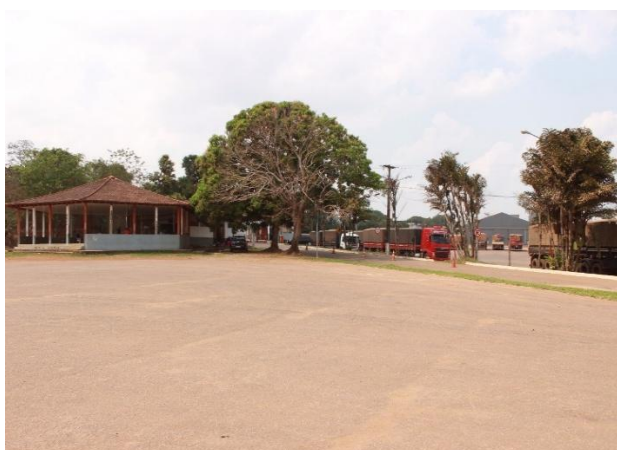
Figura 9 – Local atual do Centro de Convivência