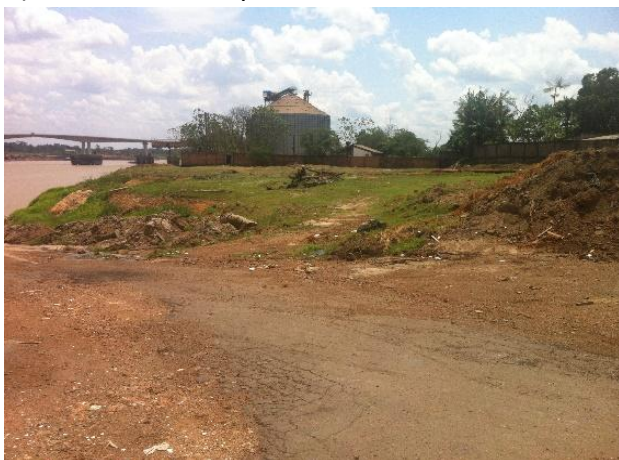
Figura 25 – Imagem Atual da Área Não Operacional