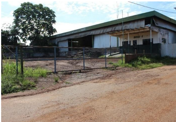
Figura 7 - Local Atual da Área Não Operacional