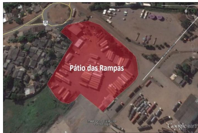
Figura 24 – Área do Pátio das Rampas