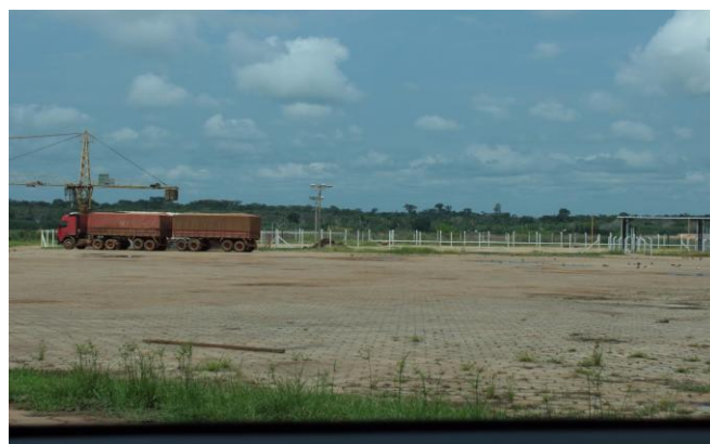
Figura 18 – Pátio