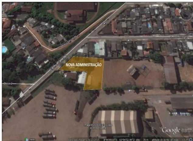
Figura 3 – Área do Futuro Prédio Administrativo