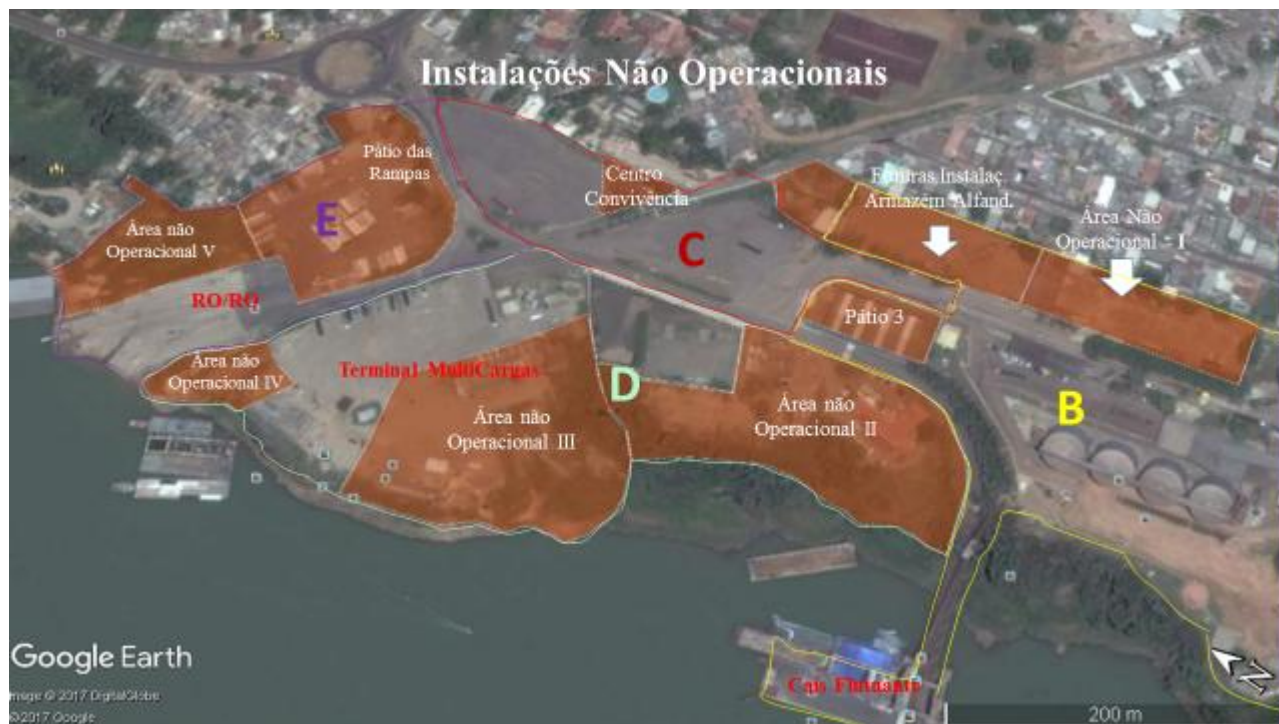
Figura 1 – Zoneamento de Áreas Não Operacionais no Plano de Desenvolvimento e Zoneamento - PDZ