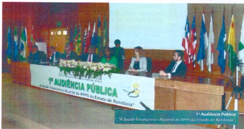
1ª Audiência Pública "A Saúde Financeira e Atuarial do RPPS do Estado de Rondônia"

Com a finalidade de debater e deliberar sobre a avaliação atuarial do estado de Rondônia e a adesão ao programa de modernização "pró-gestão" do Ministério de Previdência Social – MPS, o Instituto de Previdência dos Servidores Públicos do Estado de Rondônia realizou em 30 de novembro uma Audiência Pública, a primeira do Instituto, com o tema "A Saúde Financeira e Atuarial do RPPS do Estado de Rondônia".